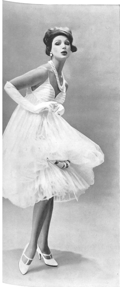
FORSTER WILLI & CO., SAINT-GALL Broderie Points d'esprit sur coton Point d'Esprit embroidered cotton Modèle : Galanos, Los Angeles