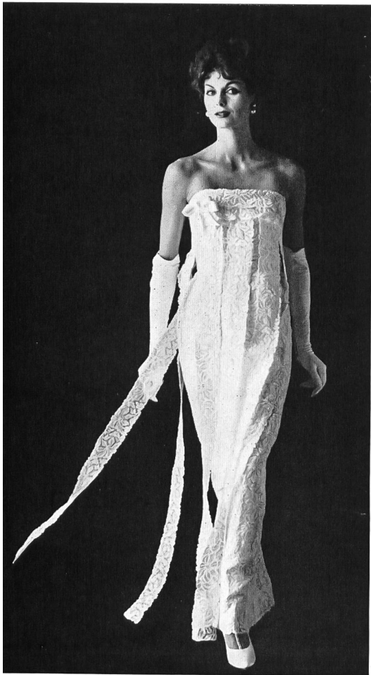
FORSTER WILLI & CO., SAINT-GALL Galons de broderie Embroidered galloons Modèle : Galanos, Los Angeles

LA «LÍNEA», TAL Y COMO SE LA VE DESDE AQUÍ