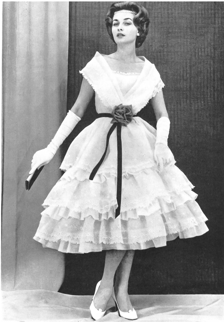
1 «RECO», REICHENBACH & CO., SAINT-GALL Organdi blanc brodé Modèle : Manuela, Nice Montex, Paris