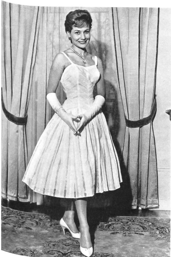
3 «RECO», REICHENBACH & CO., SAINT-GALL Tissu «Recoflora» Modèle : Delapierre, Nice Montex, Paris