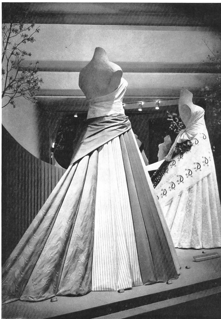
Vue partielle de l'exposition des broderies de Saint-Gall. Part view of the St-Gall embroideries' display. Vista parcial de la exposición de bordados de San Galo. Teilansicht der Sankt-Galler Stickerei-Ausstellung.

Esta exposición, siempre muy visitada, presentaba este año más de 150 tejidos diferentes y, además, 14 vitrinas con zapatos y artículos terminados tales como blusas de bordados, pañuelos estampados y bordados, vestiditos para niños, chales, galones bordados y cintas. Honraba verdaderamente a sus organizadores que fueron la Asociación zuriquense de la Industria Sedera, la Oficina de Propaganda de la Industria Suiza del Algodón y del Bordado, la Asociación de los Fabricantes Suizos de Paños, la Asociación de las Tejedurías de Estambre Suizas, y la S.A. de Fabricación de Calzados Bally.