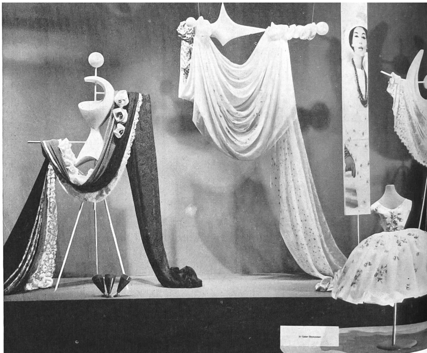
Exposición de bordados de San Galo en el «Tío vivo de la moda». Arreglo por la Sra. Tildy Grob-Wenger.