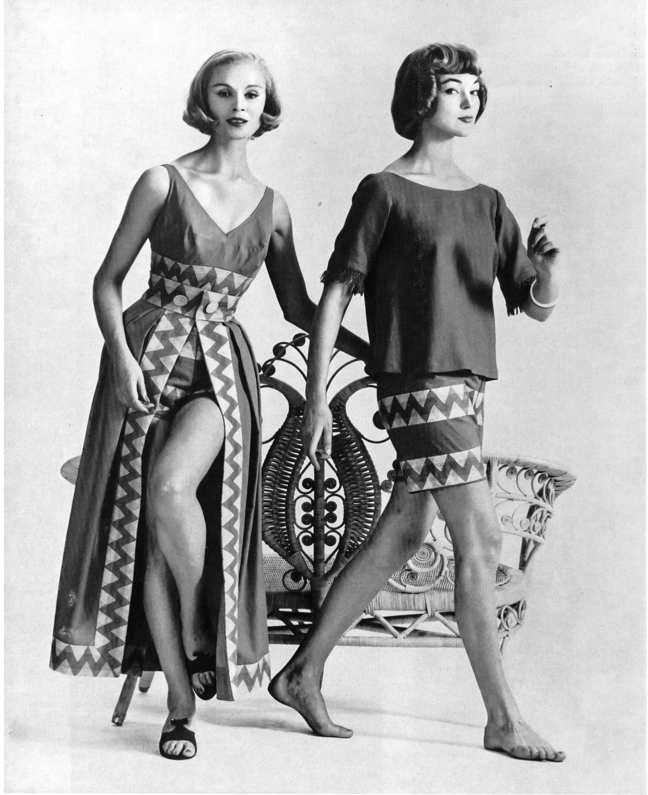
Ensembles de plage et de bain avec dessins aztèques. Beach outfits with Aztec designs. Models by Tina Leser.

Los nuevos tejidos de algodón, brochados, con efectos de tejedura calados o plisados, importados de Suiza, ocupan un puesto de honor entre lo que presentan los representantes de las casas de San Galo en Nueva York. Lo mismo se prestan para los vestidos destinados a los trópicos que para los conjuntos de calle para verano, para viaje y para los climas tan variados de los estados americanos.