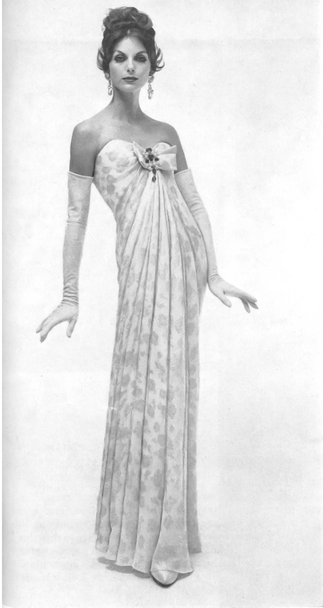
L. ABRAHAM & CO. SILKS LTD., ZURICH

Robe du soir en Basra broché. Brocaded Basra evening gown. Model by Count Sarmi for Elisabeth Arden.