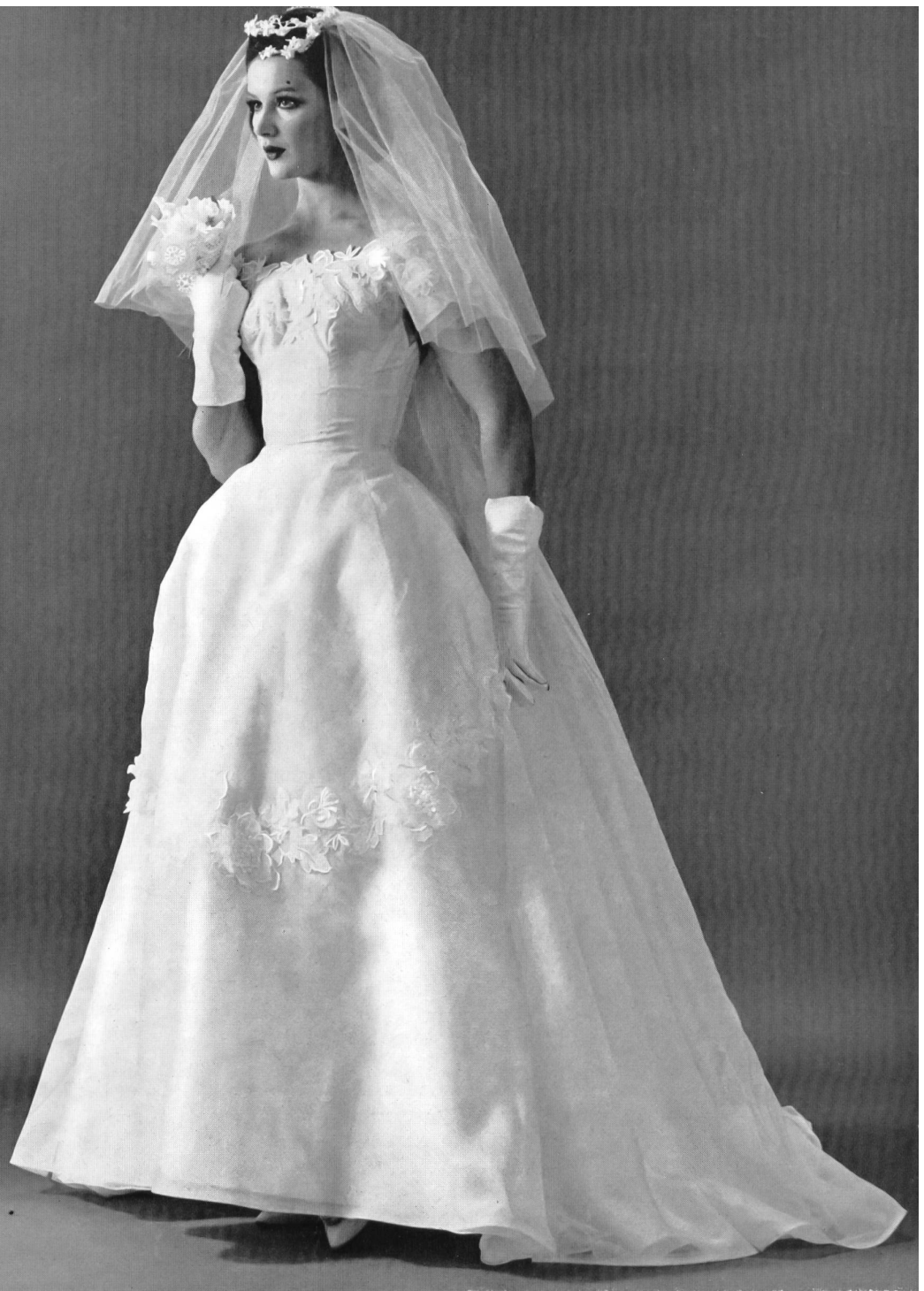
Organdi avec applications de fleurs brodées. Organdie with appliqué embroidered flowers. Model by Bianchi of Boston.

Si bien es cierto que la primavera debe empezar precozmente para la costura americana, esto se debe a que los climas cálidos de los estados del Sur, de las Islas Bahamas y de las Antillas atraen cada vez mayor cantidad de residentes permanentes y, cada año, mayor número de invernantes. Hoy en día, las travesías tropicales, las temporadas de estancia en la Florida, son accesibles a toda la población americana de la clase media. Gracias a los sueldos elevados y a las vacaciones pagadas, lo mismo los directores que los empleados de las empresas con sus respectivas familias pueden gozar de estancias de invierno bajo los cielos meridionales. Para ello, debe uno estar equipado con vestidos ligeros y poner de lado las pesadas lanas y la peletería de invierno, sin perjuicio de volvérselas a poner al volver de las vacaciones. Esto explica el porqué