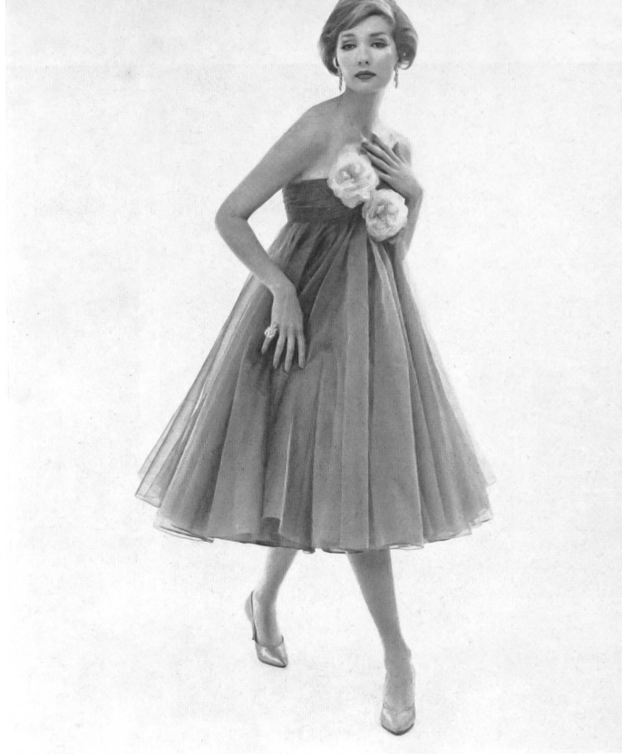
L. ABRAHAM & CO. SILKS LTD., ZURICH

Robe du soir en Basra broché. Brocaded Basra evening gown. Model by Count Sarmi for Elisabeth Arden.