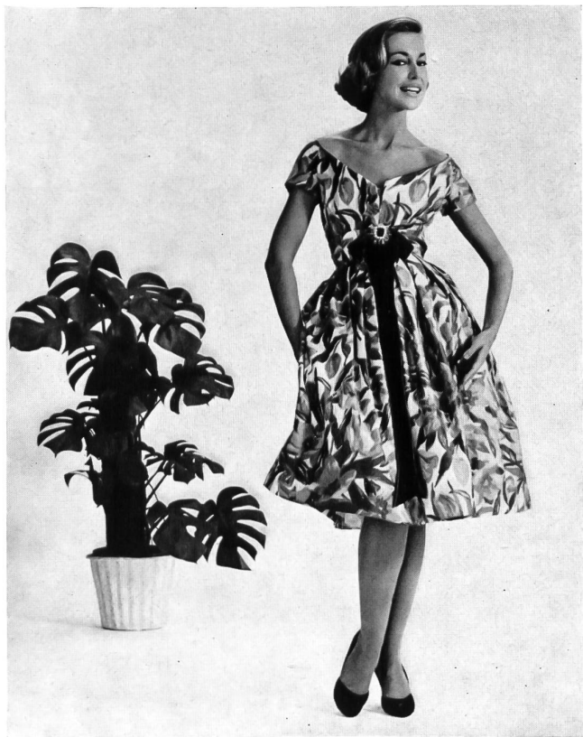
Model by Adele Simpson.