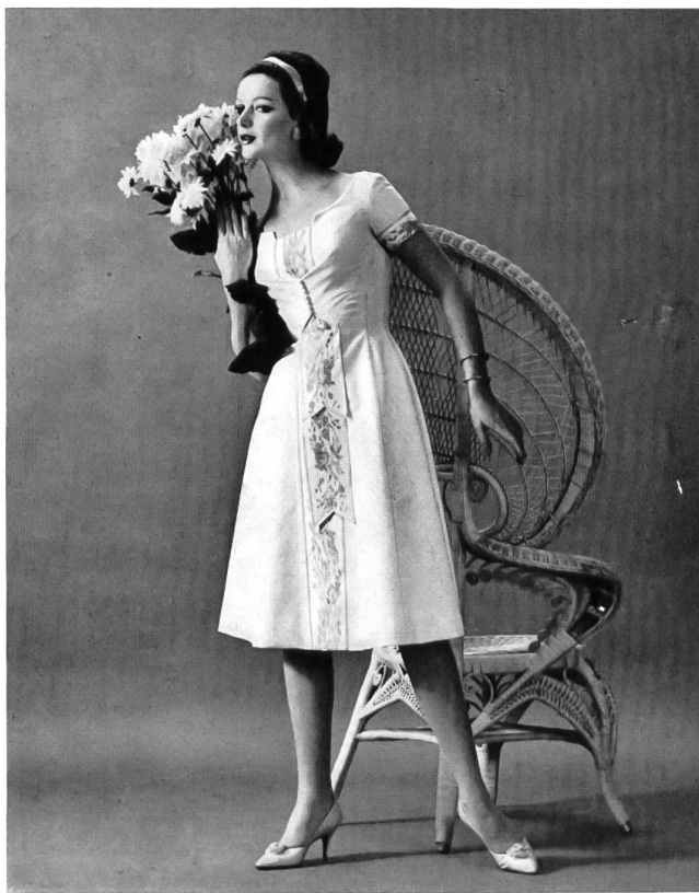
Piqué de coton et rubans brodés. Cotton piqué with embroidered ribbons. Model by Gaston Mallet.