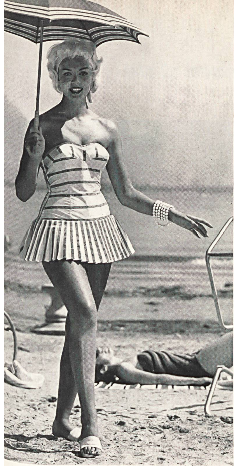
LAHCO S. A., BADEN