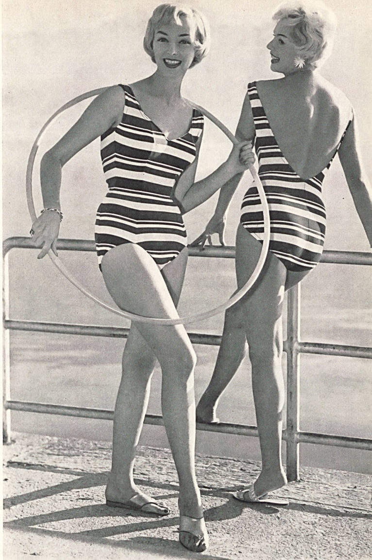
Maillot de bain en tricot de nylon « Hélanca » barré Swimsuit in horizontal striped Helanca nylon tri- cot Traje de baño, de punto de nylón « Helanca » listado Badeanzug aus « Helanca »- Nylon gestrickt mit Quer- Streifen