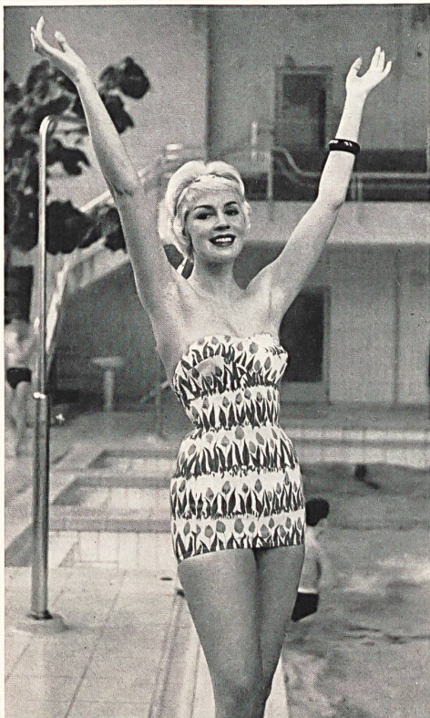
Maillot en « Hélanca » à manches 3/4, très décolleté dans le dos ; impression florale Helanca swimsuit with 3/4 length sleeves, cut low at the back ; floral printed designs Bañador de « Helanca » con mangas de 3/4 ; muy escotado en la espalda ; dibujo de flores estampadas « Helanca »-Badeanzug mit 3/4-Ärmeln und tiefem Rücken- Décolleté in sommerlichem Blumendessin