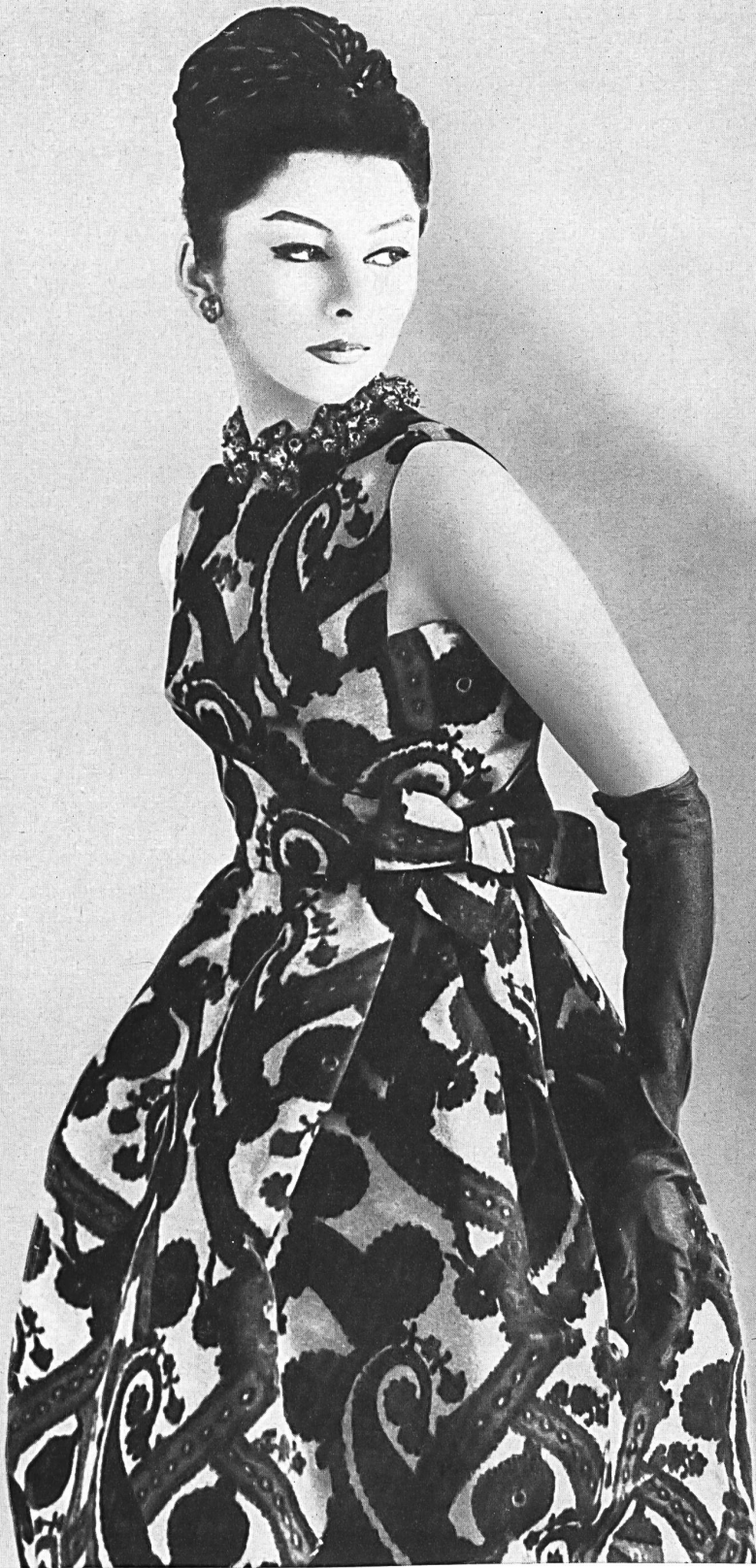
HUBERT DE GIVENCHY