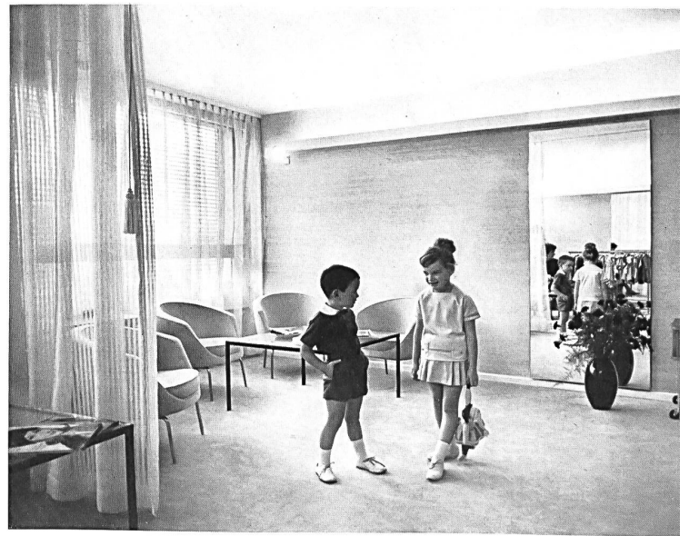
Vista de uno de los salones