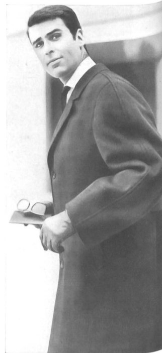
«WBC», WORMSER-BLUM & CIE S.A., ZURICH

Rayure nouvelle, veston à 3 boutons, pantalon sans revers avec ceinture réglable. — Gestreifte Neuheit, 3 Knöpfe, Hose ohne Umschlag mit verstellbarem Bund.