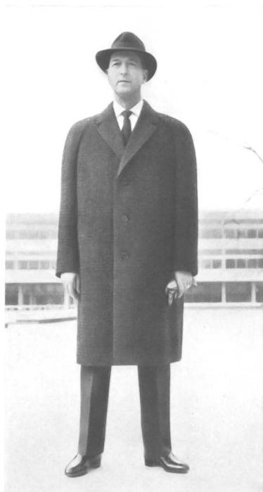
«PKZ», BURGER-KEHL & CIE S.A., ZURICH

Complet droit, 2 boutons, pans antérieurs du veston ouverts, poches en biais à patte, revers mi-pointus, pantalon étroit sans revers. Très fin tissu peigné à larges chevrons, ton vert cru. — Einreihiger Anzug, 2 Knöpfe, offener Abstich, schräge Pattentaschen, halbspitze Revers, enge Hose ohne Umschlag. Sehr feines Kammgarnewebe mit breitem Fischgratmuster in herben Grüntönen.