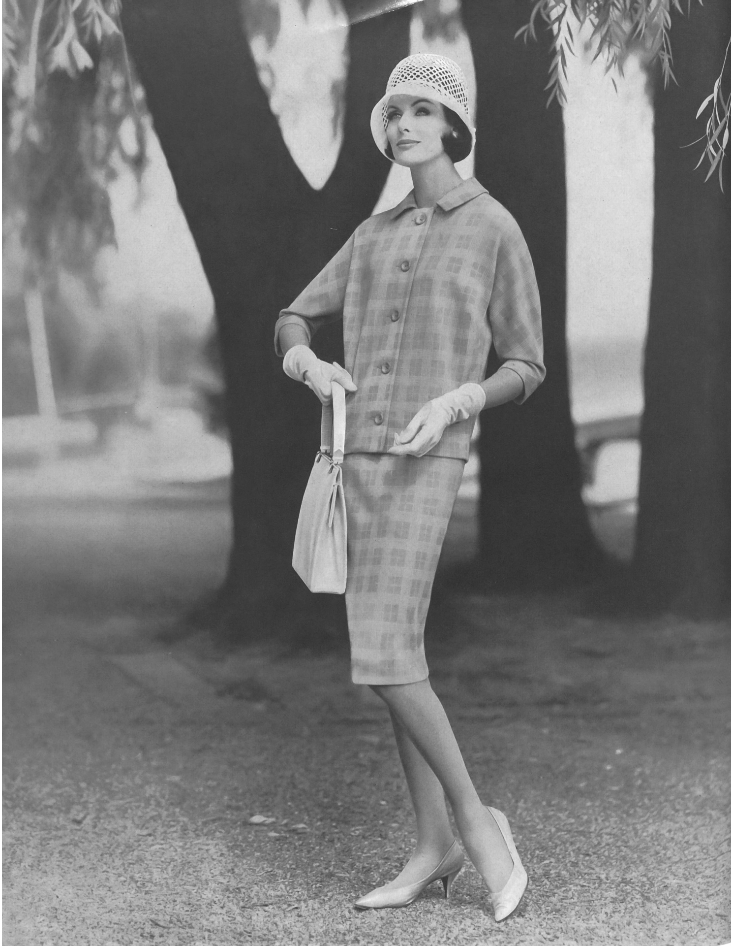
« PRIORA » 75 ans / 75 years / 75 Jahre JOH. LAIB & CIE S. A., AMRISWIL

Fabrique de bonneterie / Knitwear manufacturers / Strick-und Wirkwarenfabrik