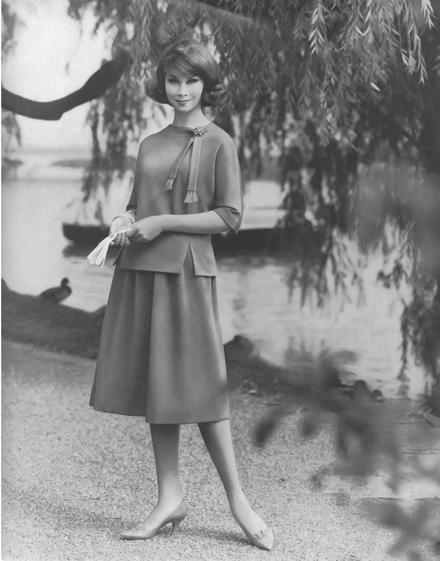
« PRIORA » 75 ans / 75 years / 75 Jahre JOH. LAIB & CIE S. A., AMRISWIL

Fabrique de bonneterie / Knitwear manufacturers / Strick-und Wirkwarenfabrik