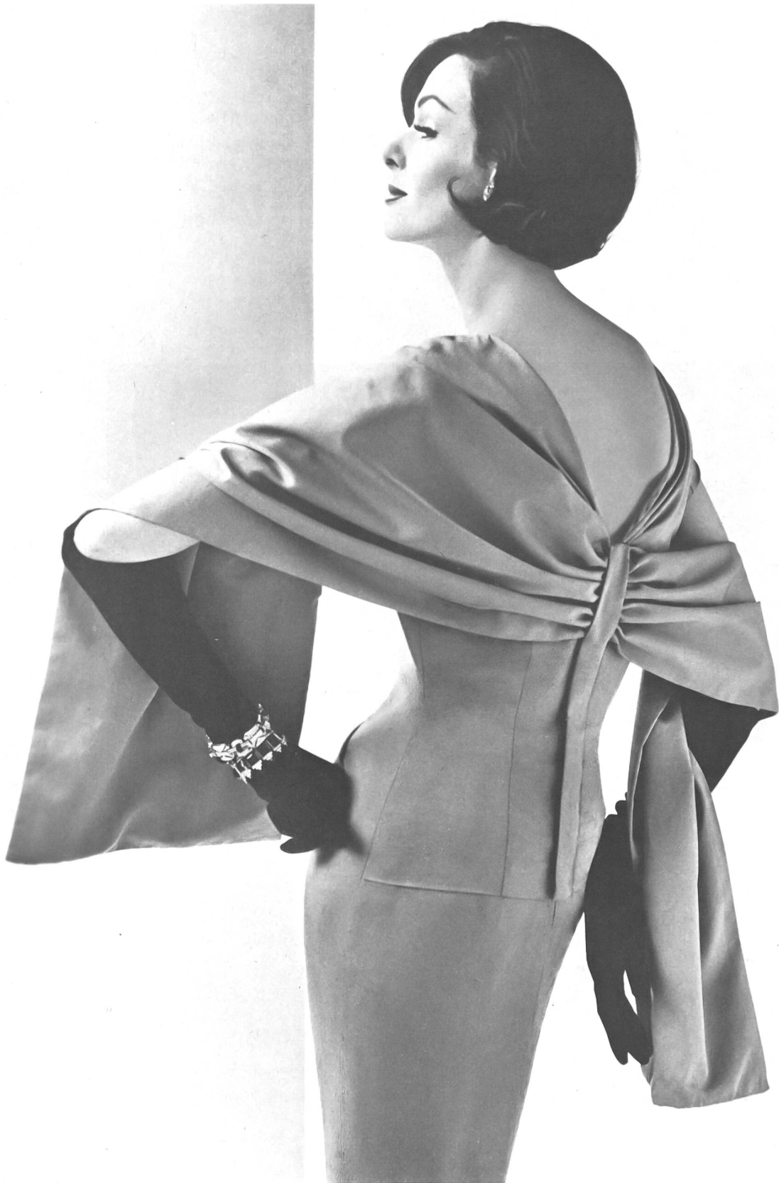
HEER & CO. S.A., THALWIL Tissu soie et laine Silk and wool fabric Modèle W. & O. Marcus Ltd., London

sido recientemente confirmado por las colecciones parisienses, de los soberbios géneros de lana cada vez más vivos, y de las telas de algodón con el acabado presti-