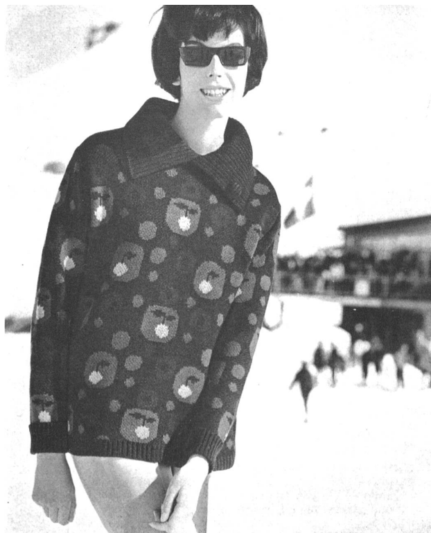
Pulóver de esquí, con dibujo jacquard moderno, cuello de moda que puede llevarse abierto o cerrado

Medio siglo al servicio de la fabricación de artículos de punto basta para crear ciertas obligaciones. Por lo tanto, no puede extrañar que los productos de esta empresa sean conocidísimos, y no sólo por su calidad, sino también por lo exclusivos y por lo originales que son sus modelos. En su programa de fabricación están incluídos actualmente los vestidos de punto para señora y caballero, al estilo de moda, empezando por los pequeños pulóveres y las chaquetas « fully fashioned », hasta los pulóveres y chaquetas para los deportes en los que están admitidas todas las audacias, sin olvidar los modelos clásicos parcialmente combinados con piel de ante de superior calidad, los pulóveres de esquiar de una elegancia muy refinada y los vestidos, los dos piezas y los trajes de punto de lo más elegante. Hemos de añadir que « Tanner » pasa por ser uno de los mejores productores de prendas de punto completamente disminuídas. En 1954 esta fábrica recibió una enorme máquina « Cotton » moderna que puede producir series de pulóveres y de chaquetas tan finas como cálidas, completamente disminuídas. Además de estos mastodontes modernos que no recuerdan en lo más mínimo al punto de calceta hecho a mano, esta empresa posee además, en su fábrica de San Galo/Bruggen, un parque muy bien surtido de máquinas perfeccionadas para la fabricación de toda clase de artículos del ramo. En unos