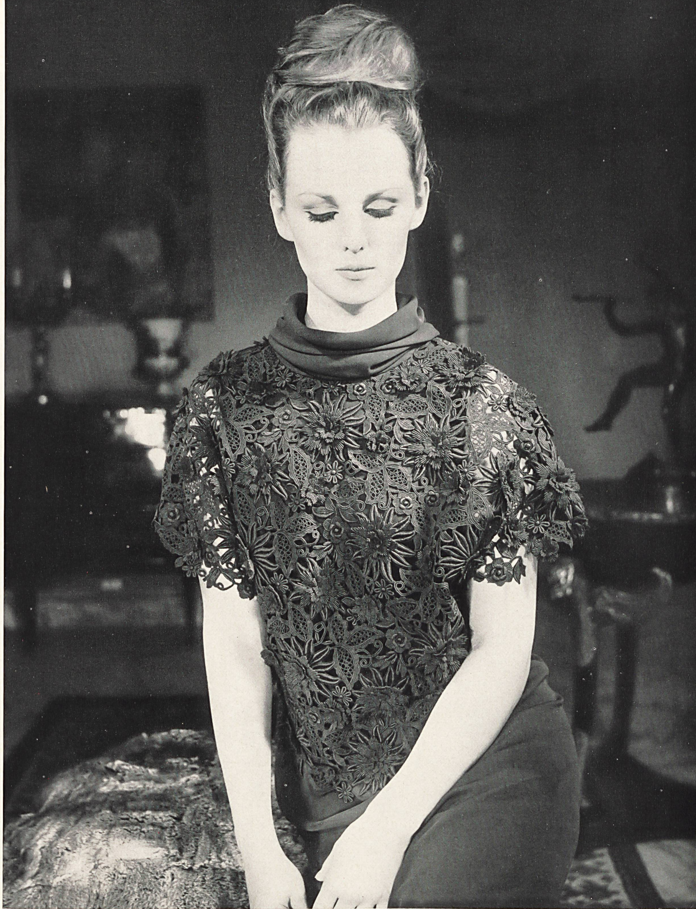
PIERRE CARDIN Dentelle de guipure avec motifs appliqués de Forster Willi & Co., Saint-Gall Grossiste à Paris: Robert Burg & Cie