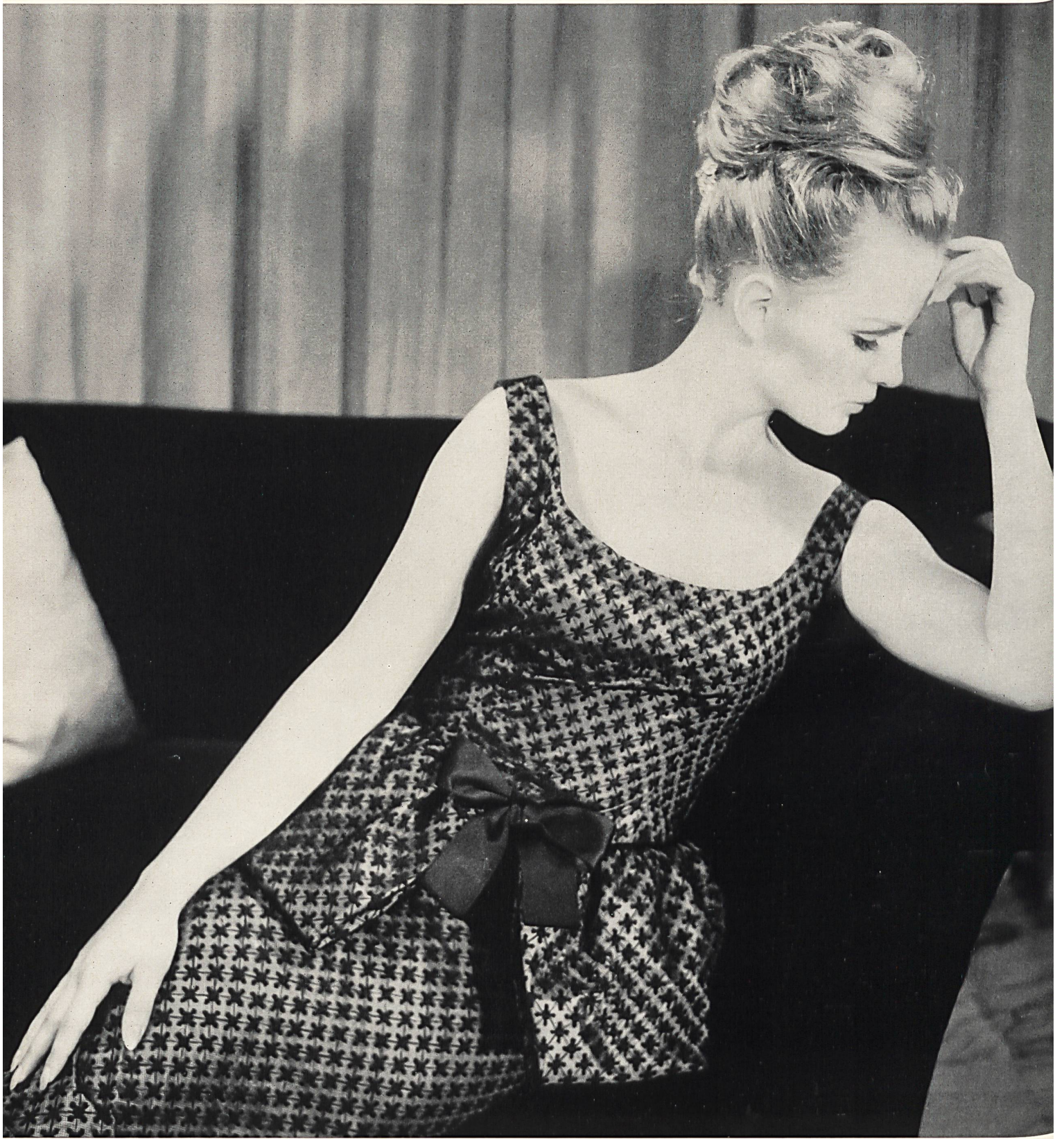
PHILIPPE VENET Tulle de nylon brodé coton de Forster Willi & Co., Saint-Gall Grossiste à Paris : Robert Burg & Cie