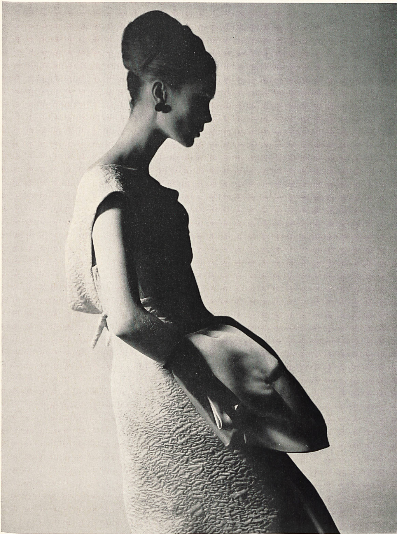
PIERRE BALMAIN Cloqué «Tric» et manteau en «Satin double face» de L. Abraham & Cie, Soieries S.A., Zurich