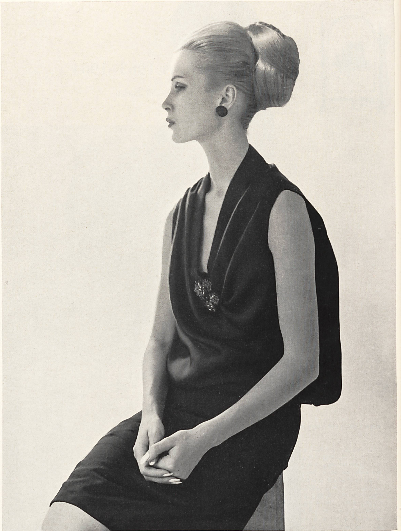
CHRISTIAN DIOR «Satin grenadine» de L. Abraham & Cie, Soieries S.A., Zurich