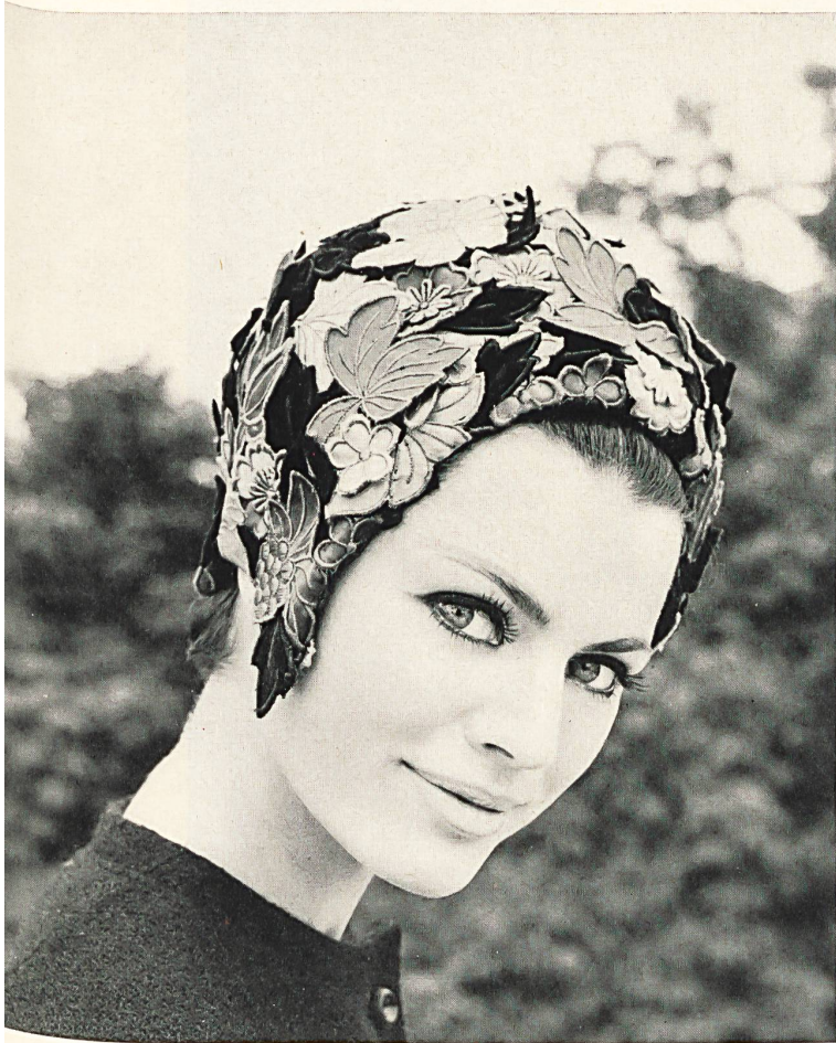
JEANNE LANVIN (DEVAUX) Dentelle découpée avec effets de superposition sur soie Duchesse couleur de Union S. A., Saint-Gall. Velours brodé et découpé de Walter Schrank & Co. S. A., Saint-Gall Grossiste à Paris : Robert Burg & Cie