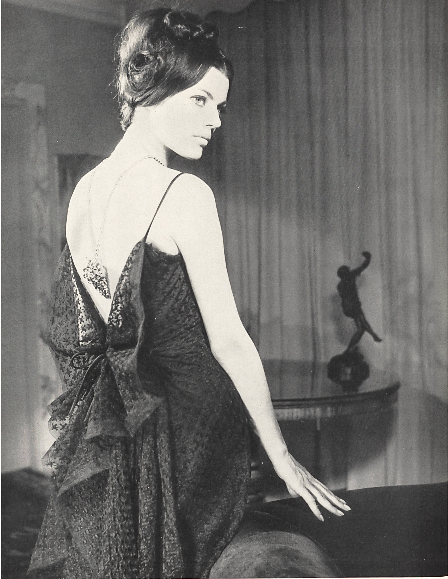
CARVEN Tulle de Nylon, coton brodé de Forster Willi & Co., Saint-Gall Grossiste à Paris: Robert Burg & Cie