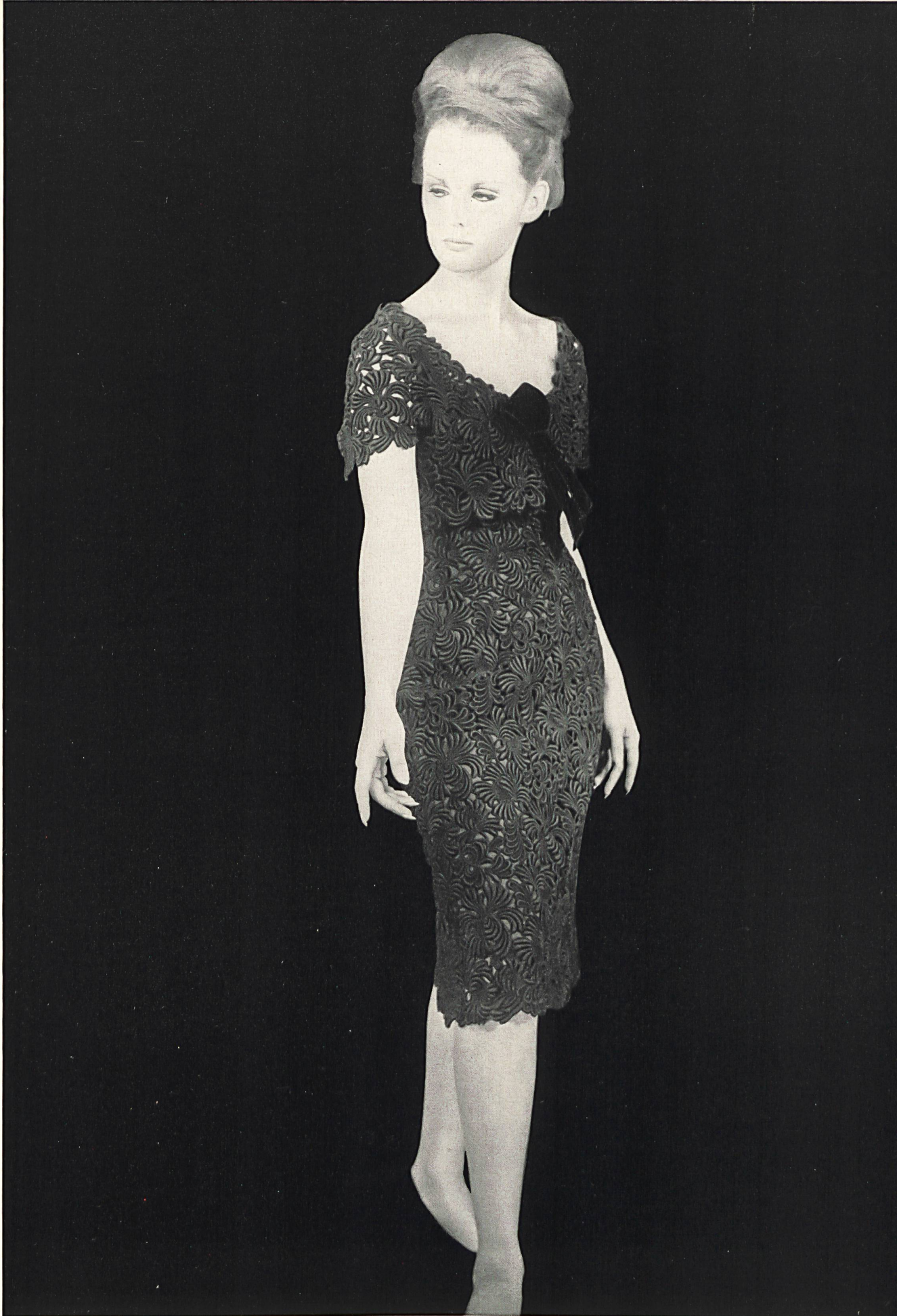
PIERRE BALMAIN Guipure de couleur de Union S. A., Saint-Gall