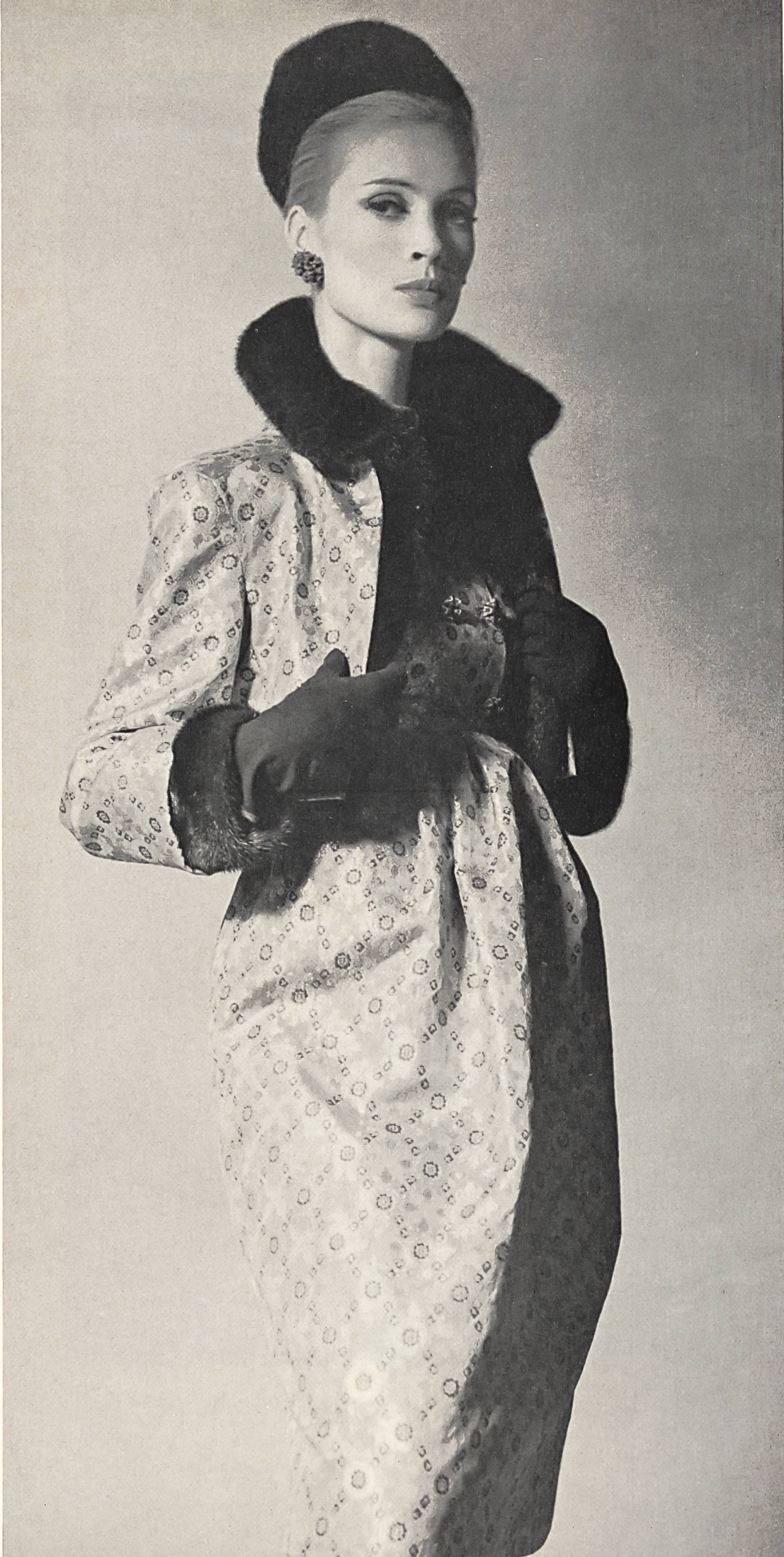
CHRISTIAN DIOR Soie brochée «Emir» de L. Abraham & Cie, Soieries S.A., Zurich