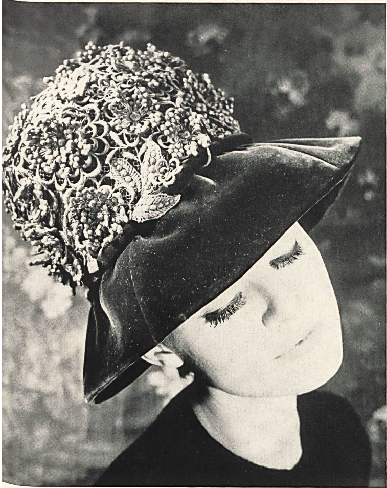
JEANNE LANVIN (DEVAUX) Dentelle de guipure avec motifs appliqués de Forster Willi & Co., Saint-Gall Grossiste à Paris : Robert Burg & Cie