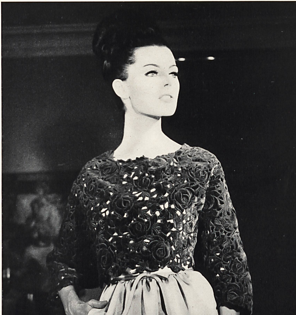
PIERRE CARDIN Dentelle de velours découpée en couleur avec effets de superposition de Union S. A., Saint-Gall Grossiste à Paris : Robert Burg & Cie