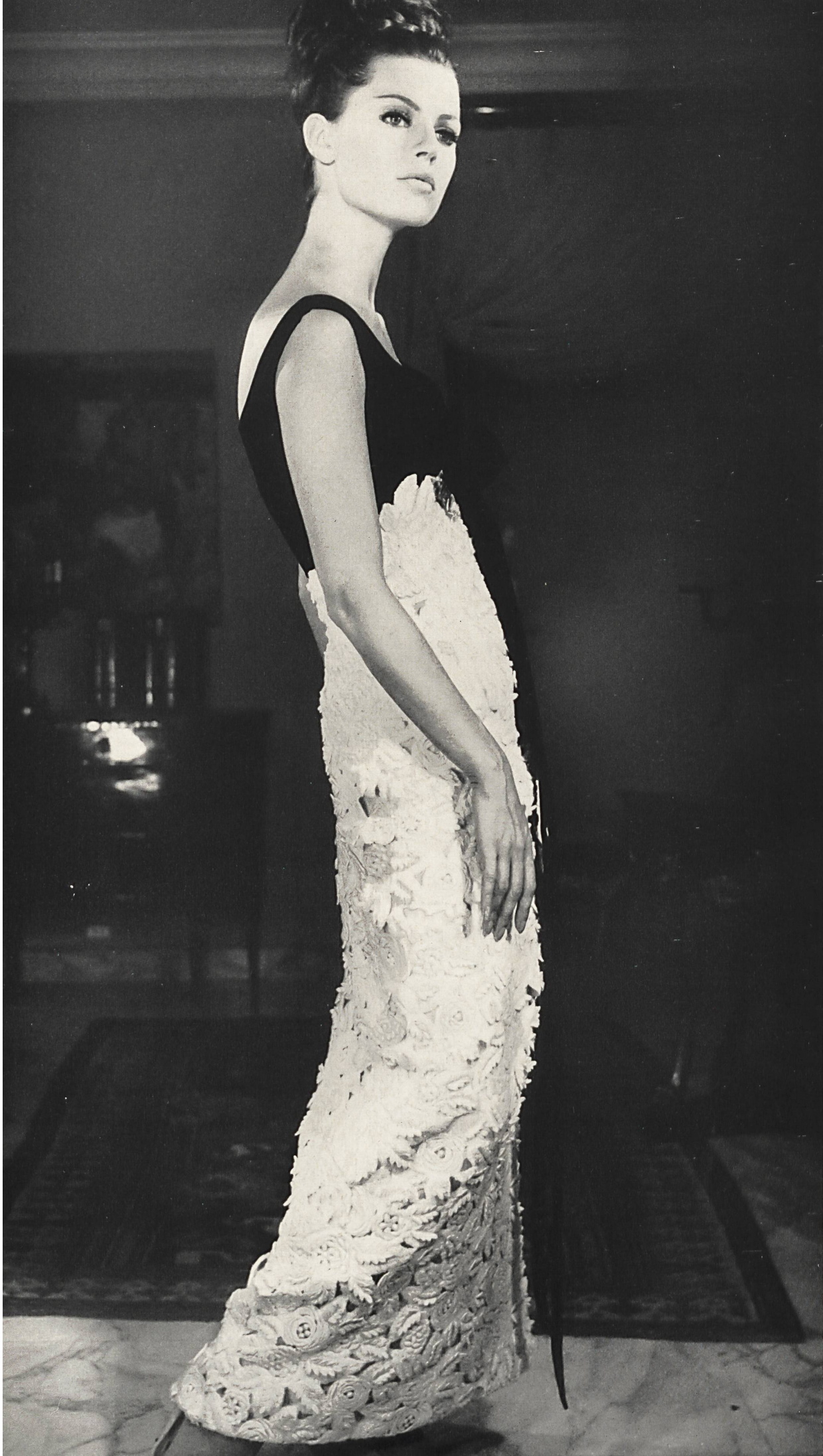
GUY LAROCHE Guipure de laine sur fond de laine, broderie superposée de Jacob Rohner S. A. Rebstein (Saint-Gall) Grossiste à Paris : Robert Burg & Cie