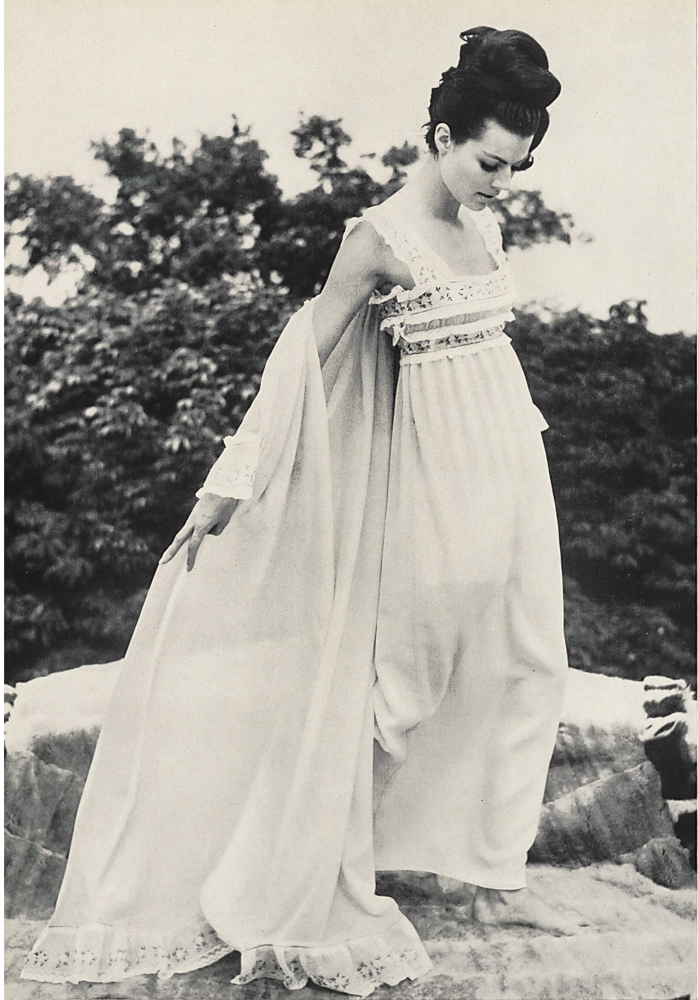
CHRISTIAN DIOR (Boutique) Bandes d'organdi brodées couleur avec dentelles de A. Naef & Cie S. A., Flawil (Saint-Gall)