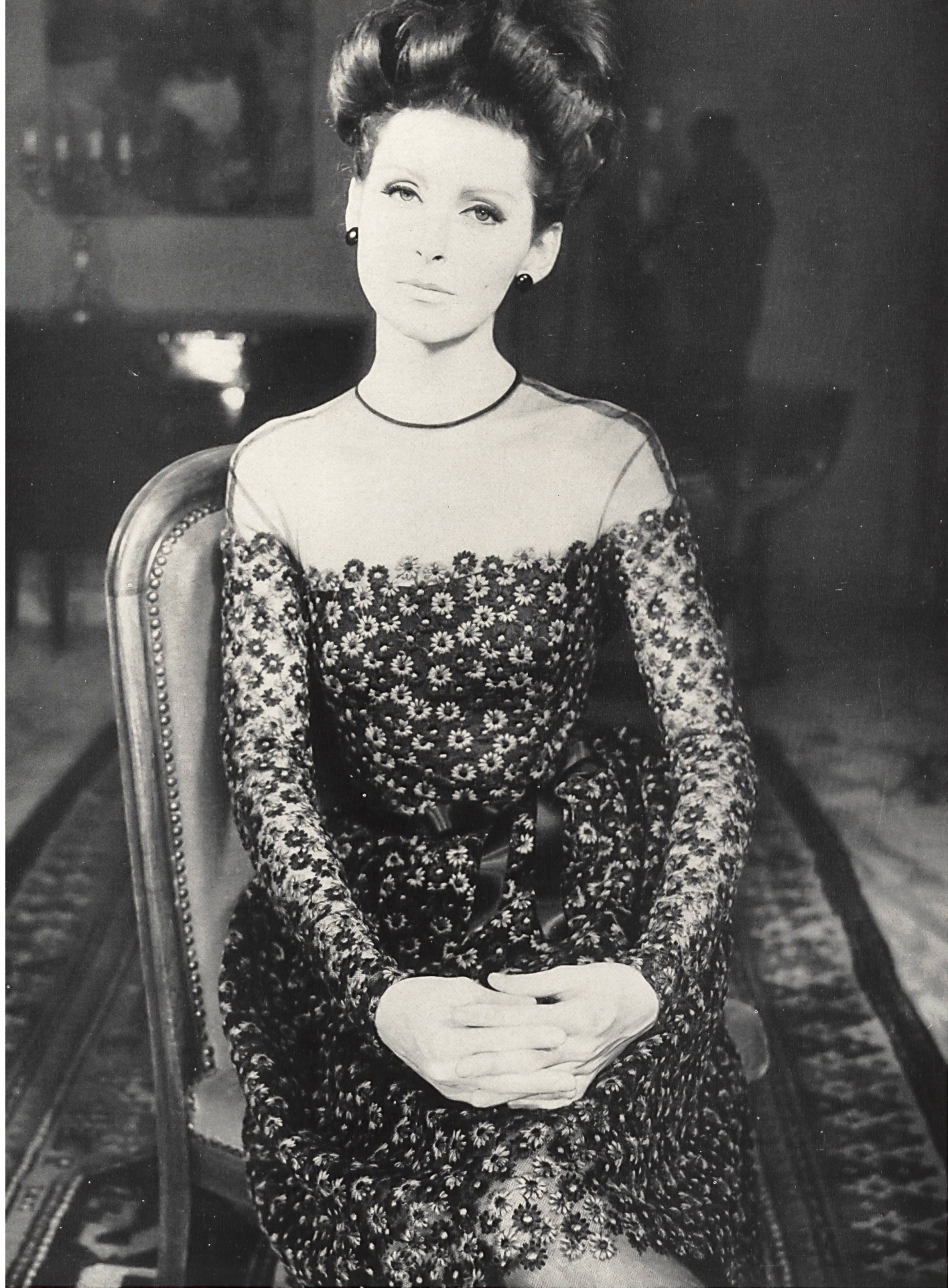
GUY LAROCHE Tulle de Nylon brodé coton de Forster Willi & Cie, Saint-Gall Grossiste à Paris: Robert Burg & Cie