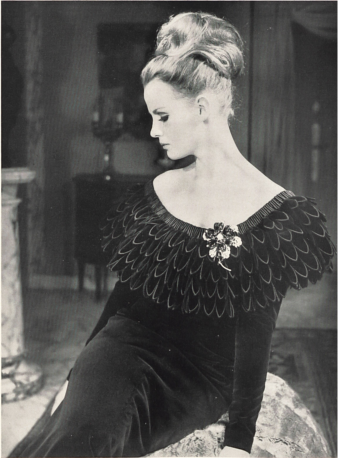
NINA RICCI Franges de velours étagées de A. Naef & Cie S.A., Flawil / Saint-Gall Grossiste à Paris: Robert Burg & Cie