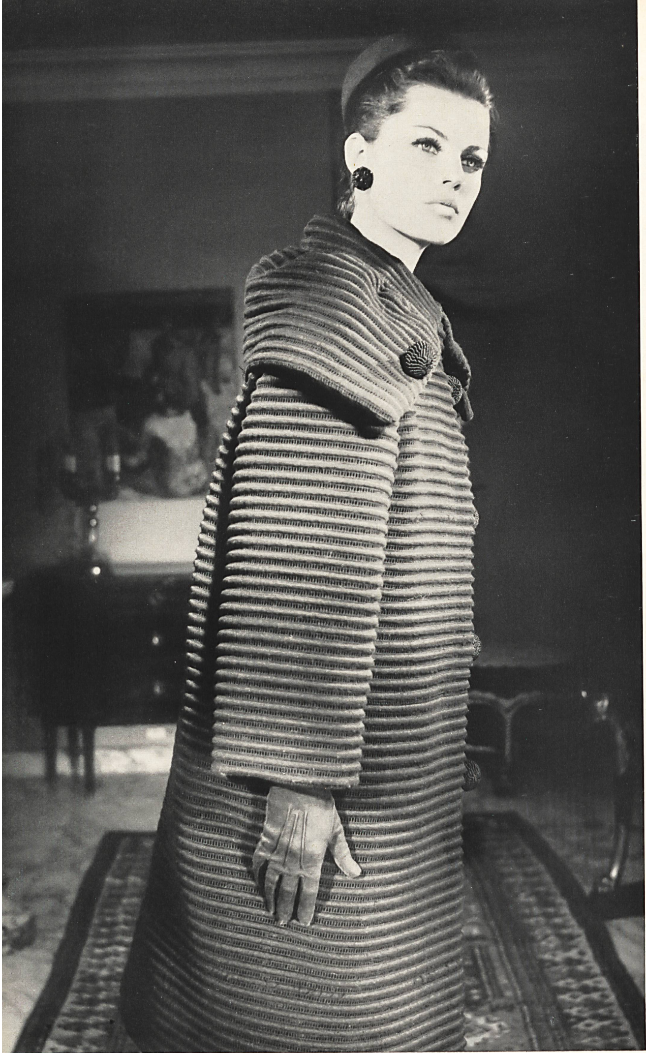
CHRISTIAN DIOR Laize brodée noire pure laine avec effets de jours de Rau S. A., Saint-Gall