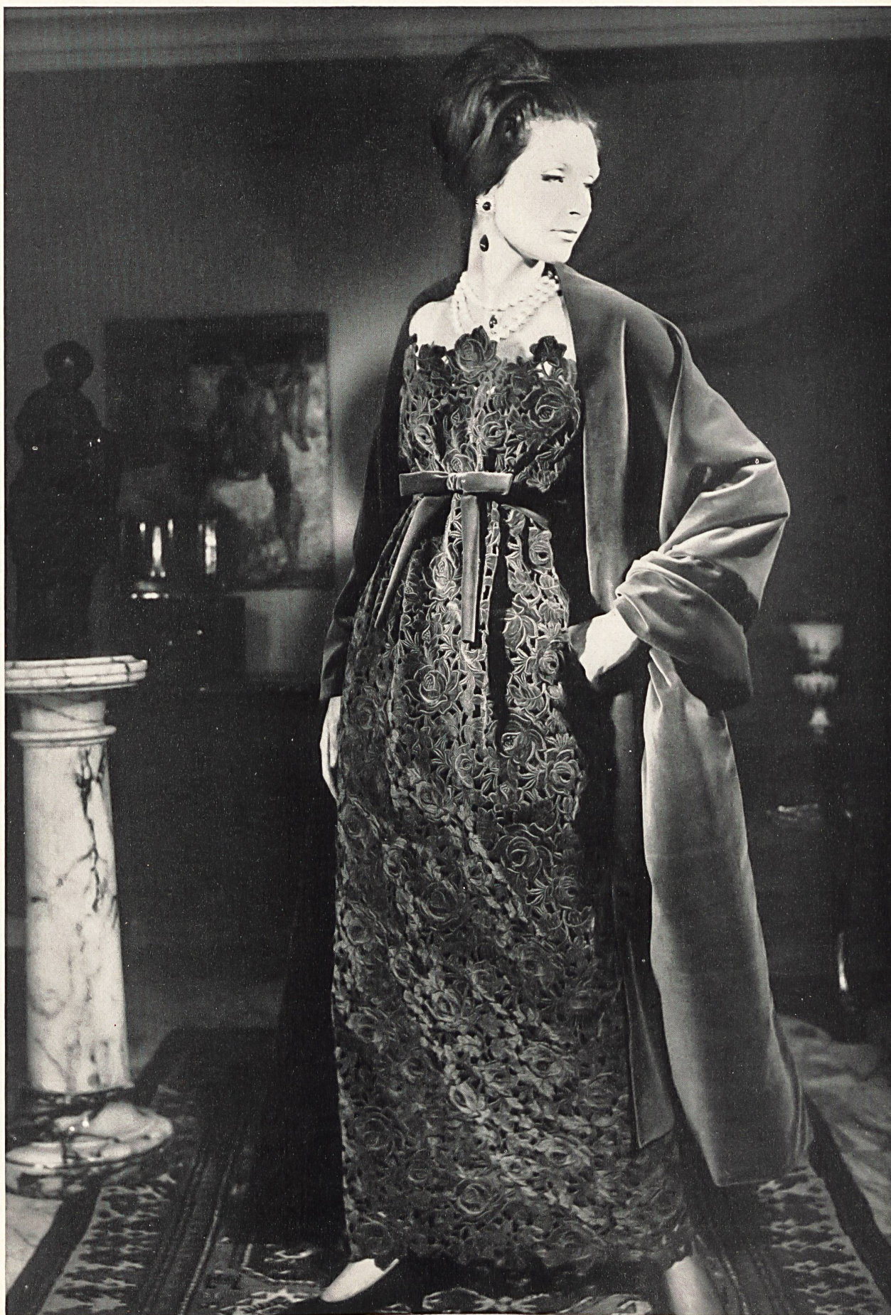
GUY LAROCHE Dentelle de velours découpé en couleur avec effets de super- position de Union S.A., Saint-Gall Grossiste à Paris: Robert Burg & Cie

MODÈLES EXCLUSIFS - REPRODUCTION INTERDITE