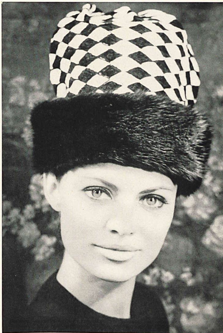
Broderie chenille blanche et noire en soie artificielle sur fond de coton de Jacob Rohner S. A., Rebstein (Saint-Gall) Grossiste à Paris : Robert Burg & Cie