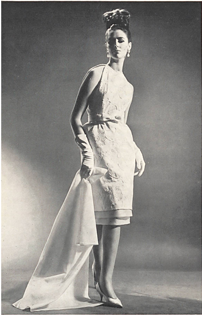
Shantung de coton brodé suisse Embroidered Swiss cotton Shantung Shantung de algodón bordado suizo Bestickter Schweizer Baumwoll-Shantung Modèle Jeanpalmério, Zurich