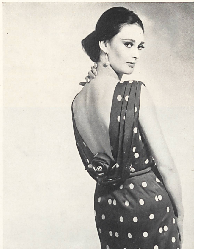
STOFFEL S. A., SAINT-GALL Shantung de coton à dessin plumetis Cotton shantung with dotted Swiss sample Shantung de algodón con dibujos de plumetis Baumwollshantung mit Plumetis-Dessin Modèle Couture Marianne, Saint-Gall

podía ver de un solo golpe de vista, las vistas tomadas por la televisión en un estudio preparado sobre el escenario y su retransmisión directa en colores sobre la gran pantalla instalada por encima. Añadiremos que el empleo del Eidophore resultó del mayor interés porque hacia posible el presentar a voluntad en plano grande a toda la sala el detalle de los tejidos y bordados empleados.