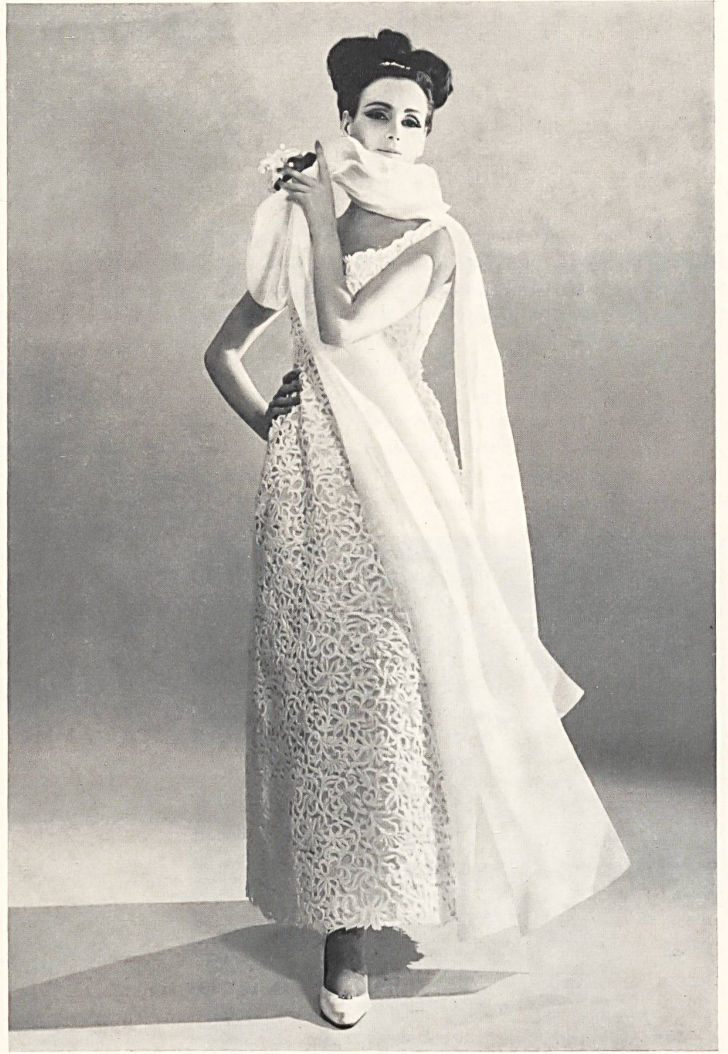
Guipure blanche de Saint-Gall St. Gall white etched lace Encaje guipur blanco de San Galo Weisse St. Galler Guipure Modèle Macola S. A., Zurich

podía ver de un solo golpe de vista, las vistas tomadas por la televisión en un estudio preparado sobre el escenario y su retransmisión directa en colores sobre la gran pantalla instalada por encima. Añadiremos que el empleo del Eidophore resultó del mayor interés porque hacia posible el presentar a voluntad en plano grande a toda la sala el detalle de los tejidos y bordados empleados.