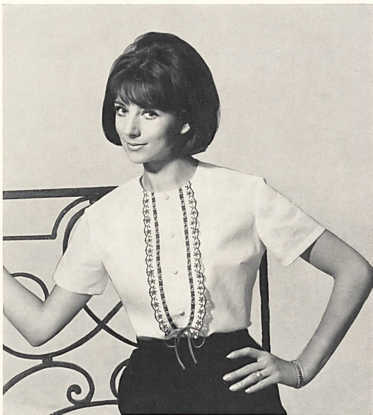
EISENHUT & CIE, GAIS Plastron brodé Embroidered dicky Pechera bordada Bestickter Plastron Modèle Valisère, Grenoble