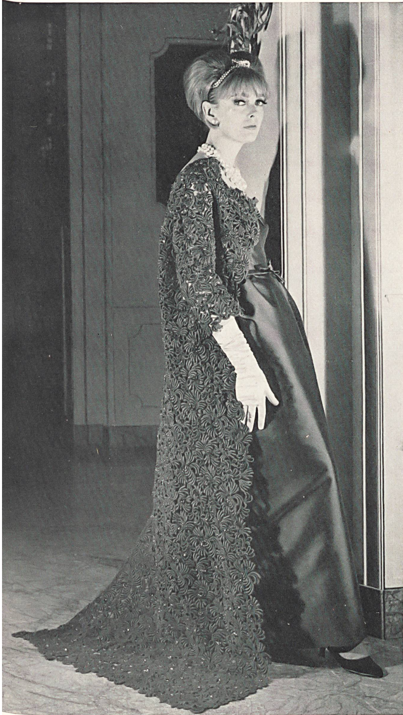
UNION S. A., SAINT-GALL Riche broderie guipure verte Rich green etched embroidery Rico encaje guipur verde Kostbare grüne Guipure-Stickerei Modèle Bicki, Milan