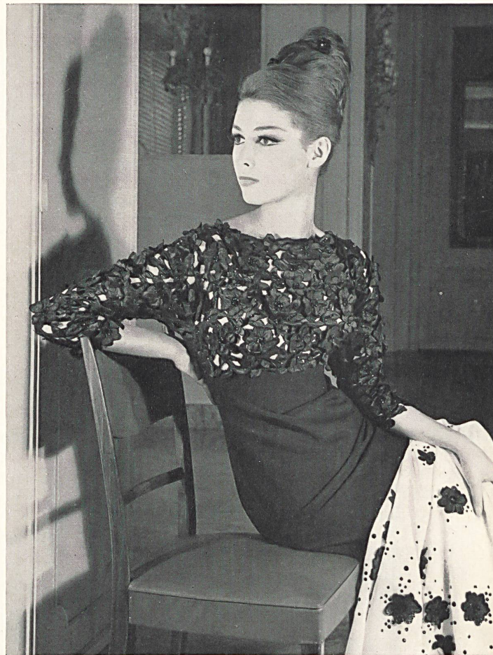
Corsage en broderie découpée verte de Saint-Gall avec appli- cations; les mêmes motifs découpés sont appliqués sur l'étole Bodice in green St. Gall cut-out embroidery with appliqué work; the same cut-out patterns are applied on the stole Corpino de encaje suizo recortado verde, con aplicaciones; los mismos dibujos recortados, aplicados sobre una estola Bolero aus St. Galler Spachtelspitze mit Applikationen; die gleichen ausgeschnittenen Muster sind auf der Stola appliziert Modèle Emilio Schuberth, Rome