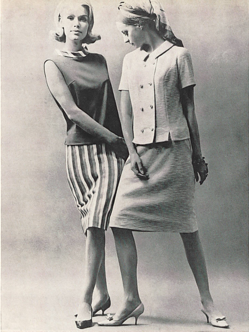
◀ JOSEPH BANCROFT & SONS CO. AG., ZURICH Swiss Minicare Jersey Modèles: « Yala », Laib Yala Tricot S.A., Amriswil