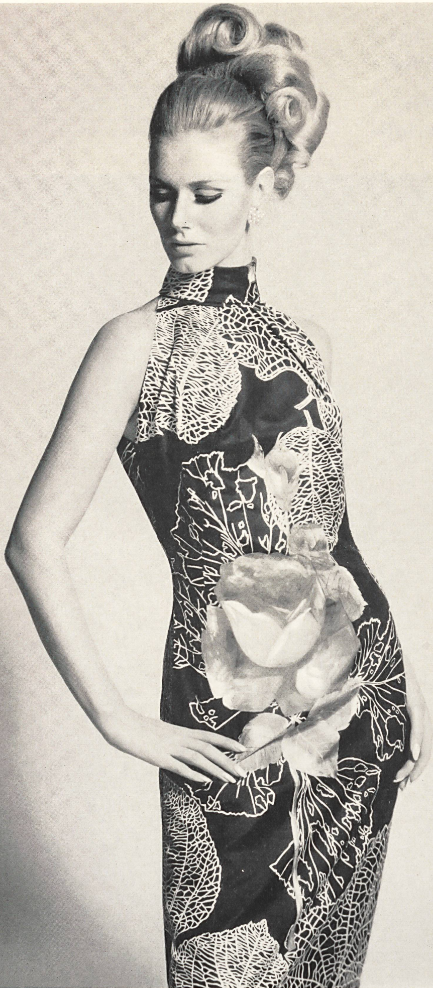
RIBA SOIERIES S.A. ZURICH Tissu « Papillon » Modèle: Gack, Zurich