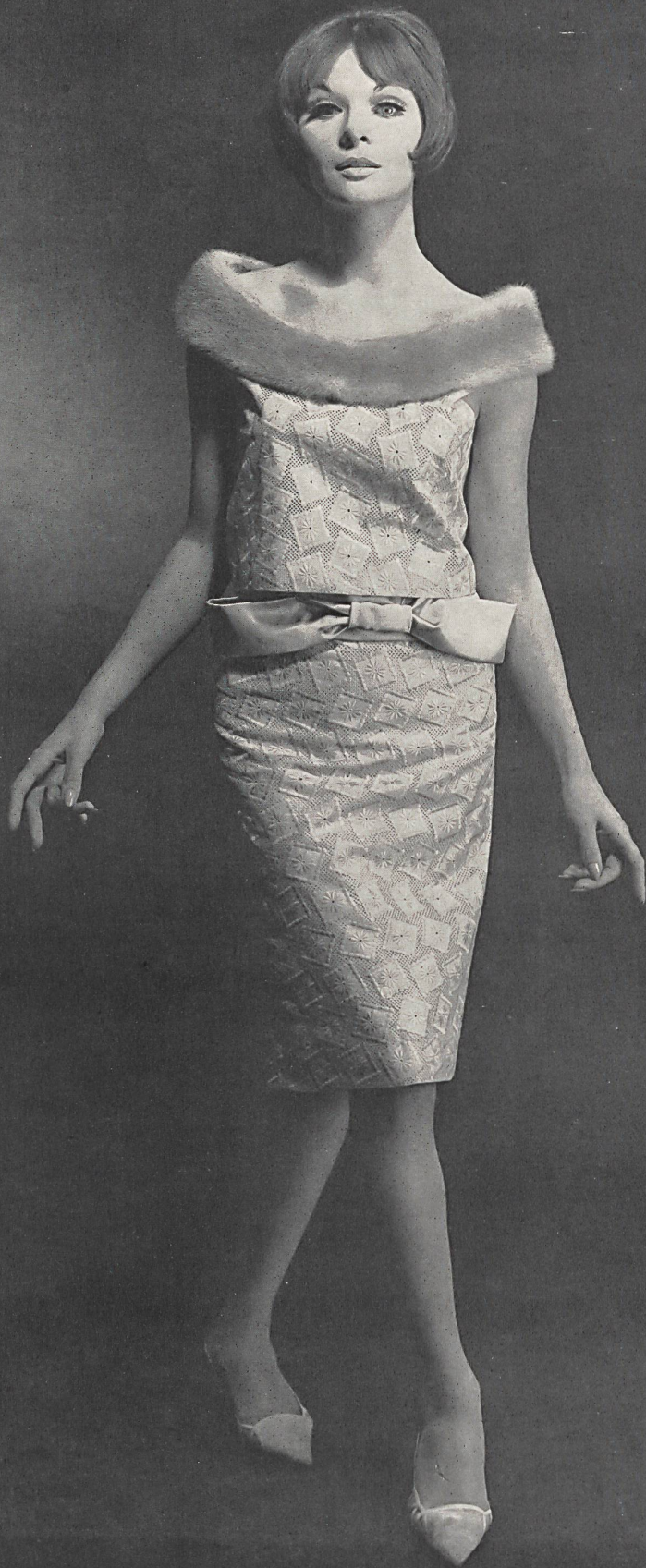
« ABC », ALEX BAUER & CO., SAINT-GALL Batiste brodée / embroidered / bordada / bestickt Modèle épinglé pin dress model Modelo sujeto con alfileres por / aufgestecktes Kleid von: Werner Hoehn, Zurich