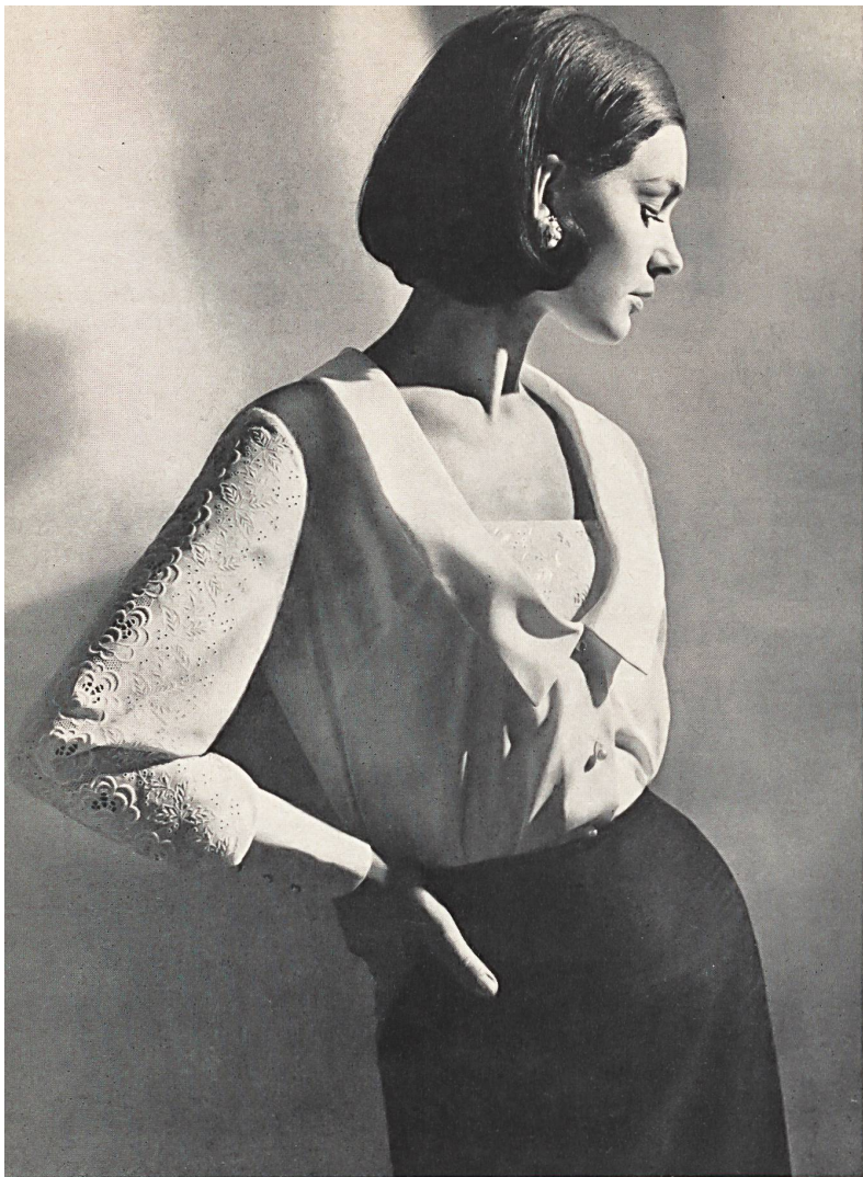
◀ « ABC », ALEX BAUER & CO., SAINT-GALL Broderie sur « Sedusa », pur Térylène Embroidered pure Terylene « Sedusa » fabric Bordado sobre « Sedusa » 100 % Terylene Bestickter « Sedusa » 100 % Terylene Modèle: Renommée S.A., Montreux