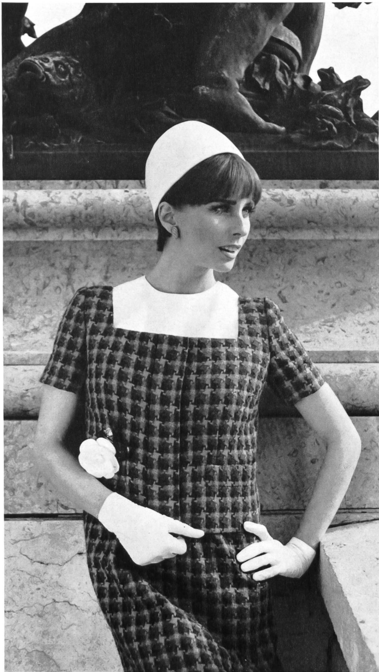
Kammgarnweberei Derendingen, Derendingen Natté pure laine vierge