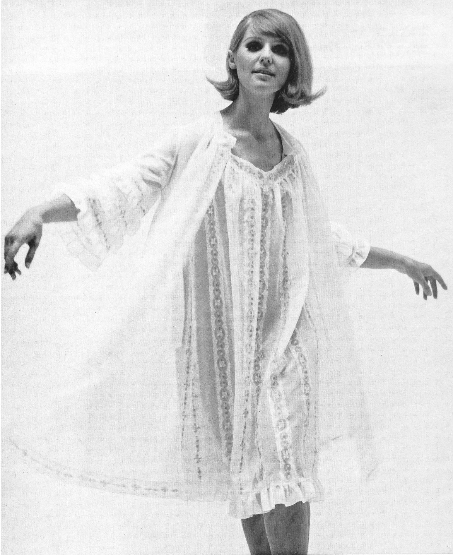
Ensemble de lingerie brodé en blanc et couleur Modèle Drei-Stern: Leumann, Boesch & Cie S. A., Kronbühl Broderie sur fond de fibre synthétique: Forster Willi & Cie, St-Gall