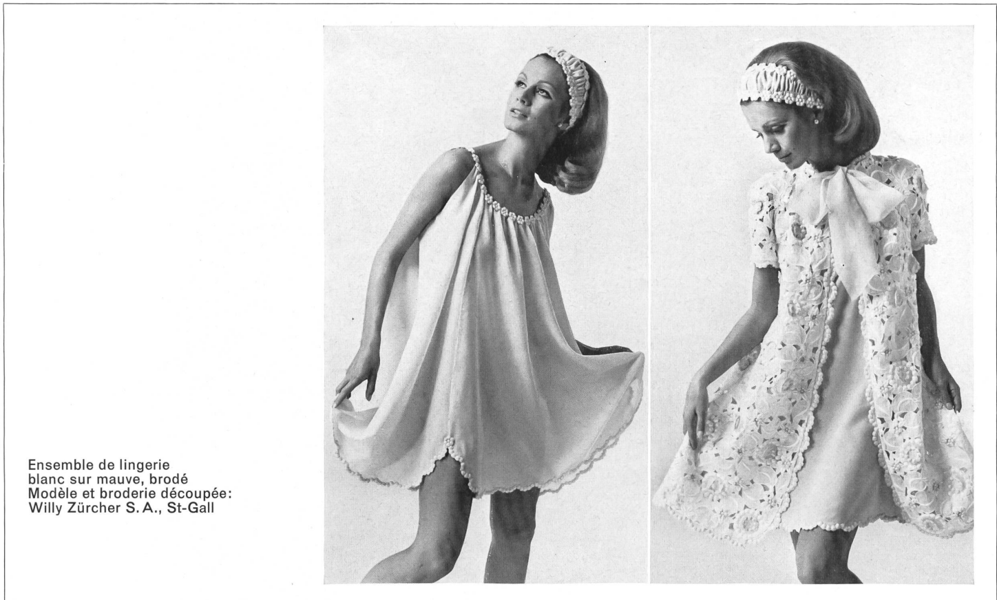
Ensemble de lingerie blanc sur mauve, brodé Modèle et broderie découpée: Willy Zürcher S. A., St-Gall