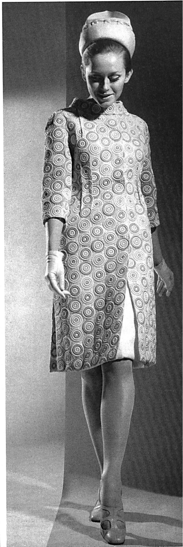
Sculptured embroidery by Fisba of St. Gall