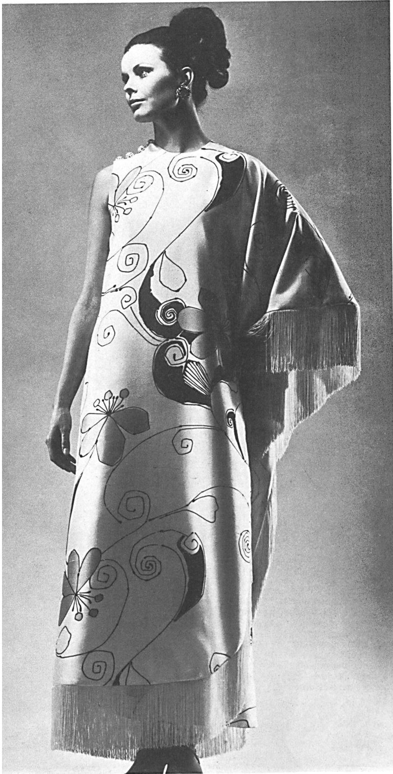
FISBA DE SAINT-GALL Shantung Gala en imprimé blanc et turquoise, avec franges blanches Modèle Toni Schiesser, Francfort