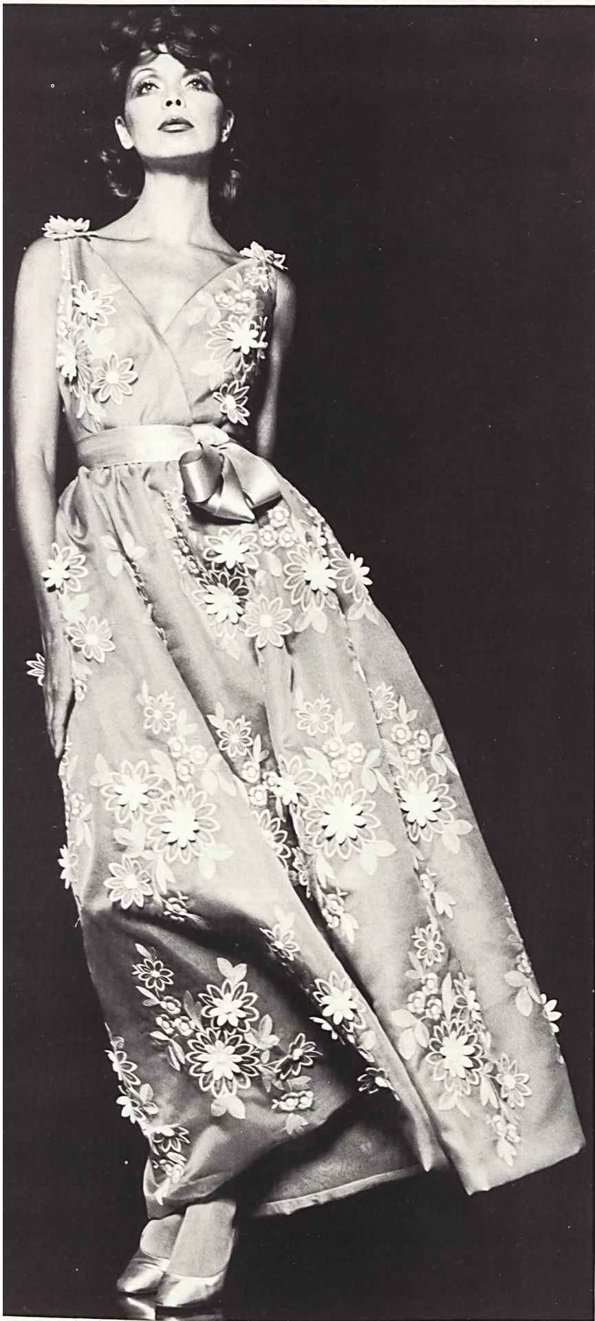
◀ Abendkleid aus besticktem Organza mit Blüten-Applikationen. Stickerei: A. Naef & Co. AG, Flawil