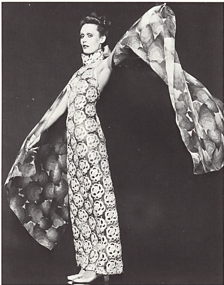
Abendkleid aus himbeerfarbigem ▲ Orgazine und weisser Paillettenstickerei mit Rosenmotiven. Stickerei: Jakob Schläpfer & Co. AG, St. Gallen