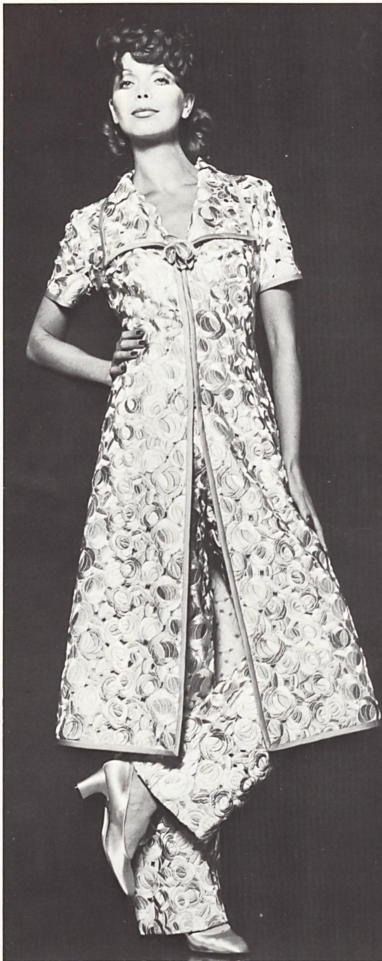
Hosen-Anzug mit Mantel aus ► besticktem Organza in Bronze, Gold und zartem Grün. Stickerei: Forster Willi & Co., St. Gallen