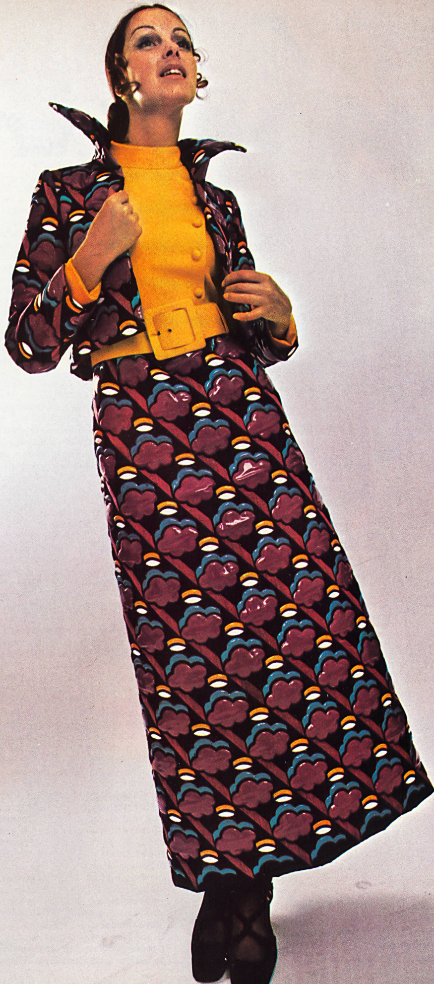
HEINZ RIVA Malvenfarbige Stickerei auf schwarzem Organza mit mehrfarbigen Vinyl-Applikationen von Jakob Schlaepfer & Co. AG, St. Gallen