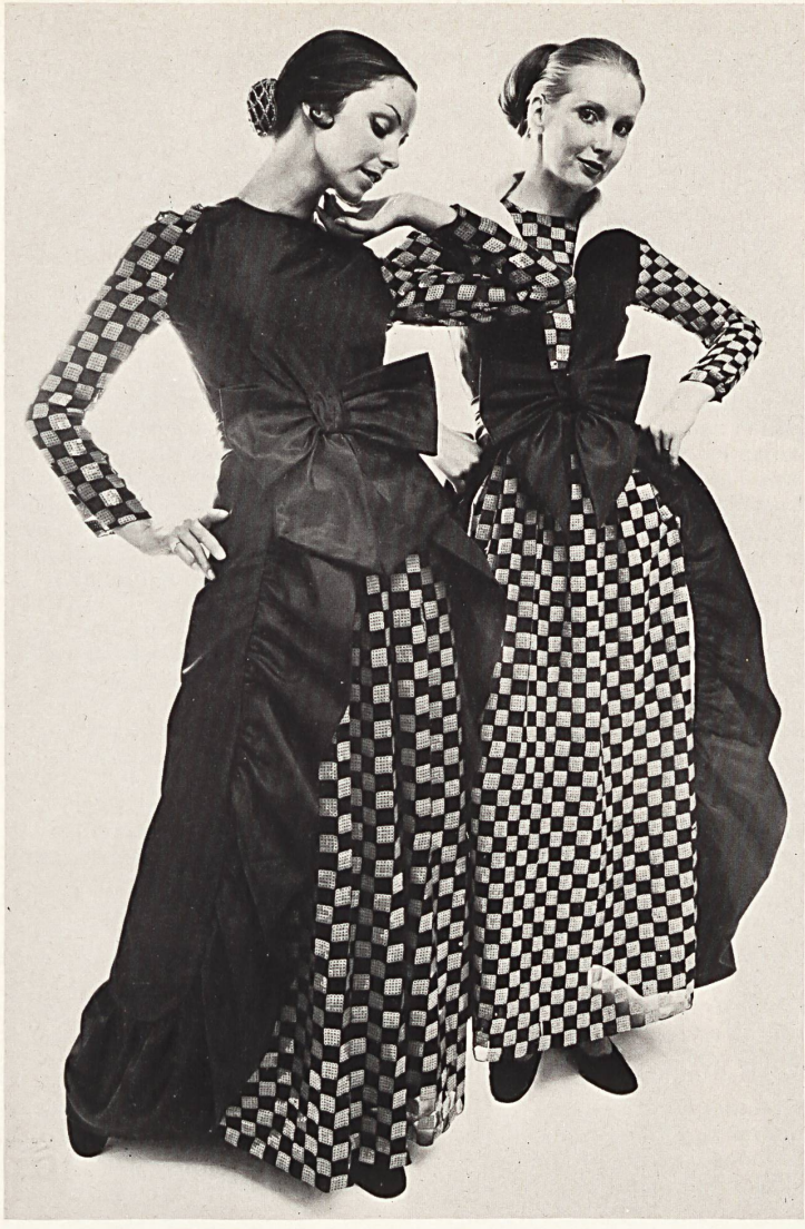
BAROCCO Schwarzer Georgette, bestickt mit schwarzen und schwarz/weiß bedruckten Pailletten von Jakob Schlaepfer & Co. AG, St. Gallen