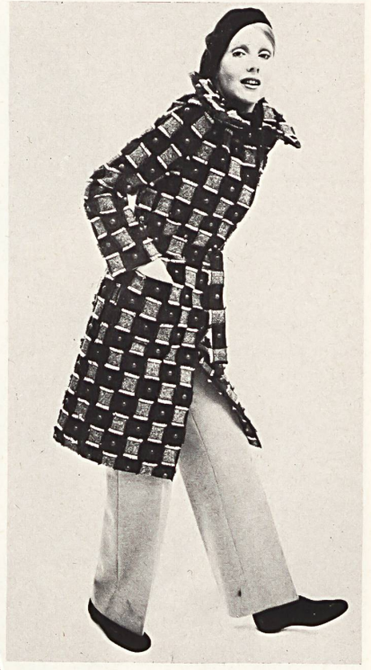
ANDRÉ LAUG Stickerei auf braunem Duskin mit Tweedkaros und applizierten Holzperlen von Jakob Schlaepfer & Co. AG, St. Gallen