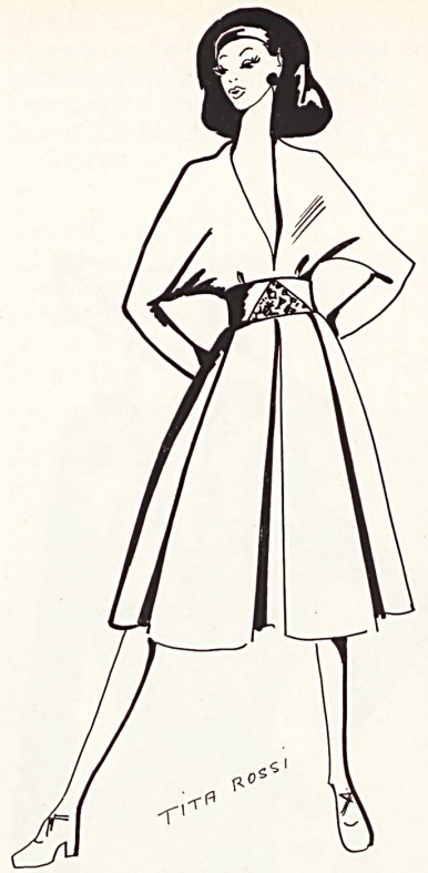
SARLI Schwarze Paillettenstickerei auf Gentina von Jakob Schlaepfer & Co. AG, St. Gallen