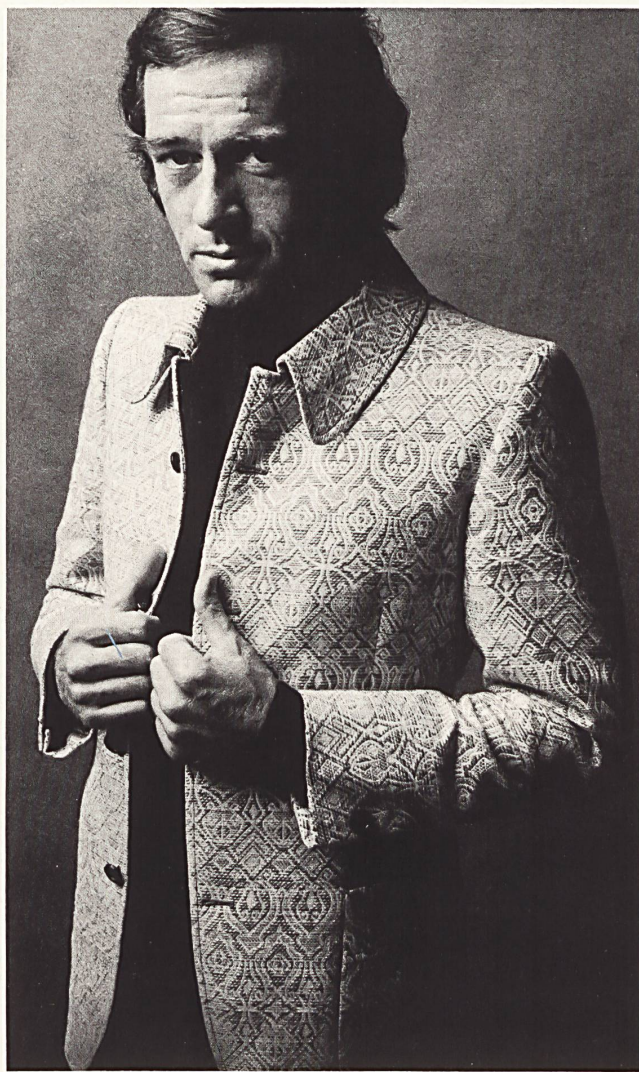
CHRISTIAN FISCHBACHER CO., ST. GALL «Opera» multicoloured jacquard