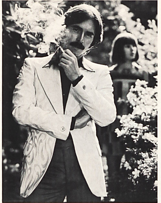
1. Original jacket in casual cotton "Piqué Cocktail" by Mettler & Co. Ltd., St. Gall. (Model: Lenox Ltd., Allstätten).