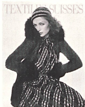
YVES SAINT-LAURENT Mousseline de laine imprimée de Abraham