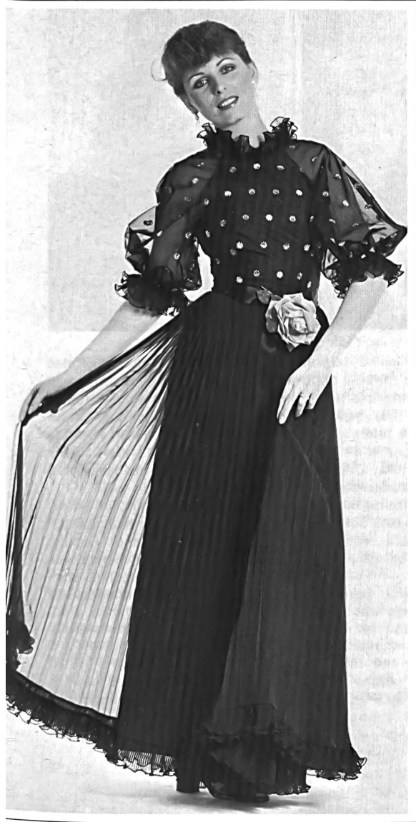
A. NAEF AG, FLAWIL

Embroidered organza top combined with a long pleated chiffon skirt.