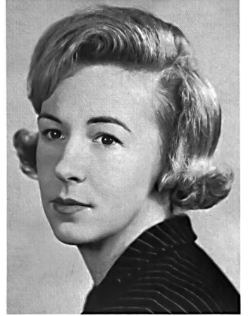
WEISBROD-ZÜRCHER AG HAUSEN a.A.

Full length evening gown in white "Lascara" pure spun viscose, with navy blue shawl and white flowers.