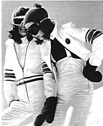
◀ Originelle Ski-Anzüge aus Antigliss-Nylon für die Sicherheit.

St-Denis ihr 25jähriges Bestehen feiern. Gerade weil die Mode-Industrie im Welschland nicht stark vertreten ist, verdient dieser Meilenstein in der Geschichte des Unternehmens, das mehr als 30 % seiner Produktion in die europäischen Länder exportiert, eine besondere Beachtung.