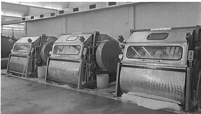
Moderne Schnellwäscher Modern rapid washing machines