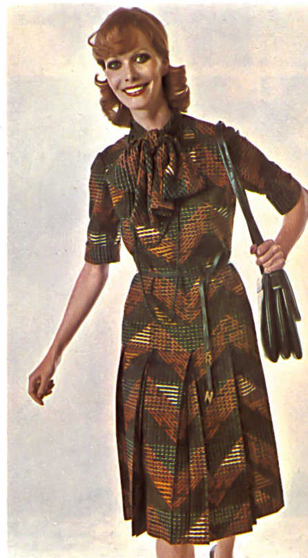
FILTEX AG, ST. GALLEN Chemisekleid mit modischem Stehkragen, Längspasse und plissiertem Rockteil aus bedruckter Wollmousseline. — Robe chemise en mousseline de laine brodée avec col droit mode et jupe plissée. — Shirtwaist dress in wool mousseline print with fashionable stand-up collar and pleated skirt.