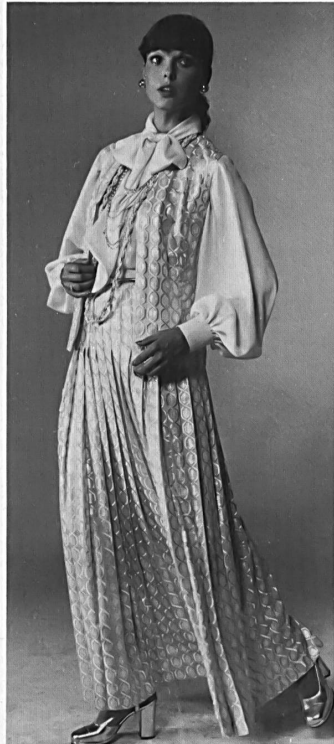
JAKOB SCHLAEPFER & CO. AG, ST. GALLEN Grosses, plissiertes Abendkleid aus besticktem beige Chiffon mit Pailletten und Seiden-Stickerei, bestehend aus Faltenrock, Bluse und Cardigan. — Grand ensemble du soir en chiffon beige, avec broderie de soie et de paillettes, composé d'une jupe plissée, d'une blouse et d'un cardigan. — Gala pleated skirt, blouse and cardigan in beige embroidered chiffon with sequins and silk embroidery.