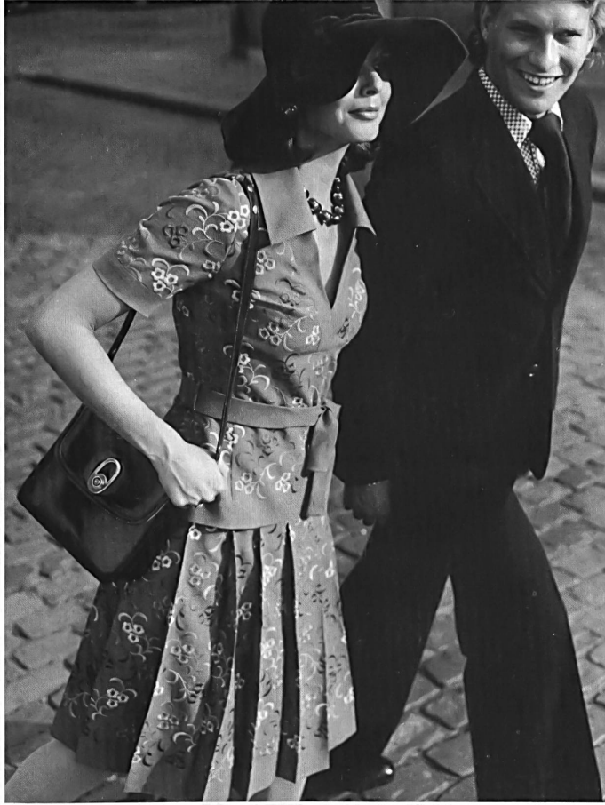
4. A. NAEF AG, FLAWIL Nachmittagskleid mit originellen Faltvolants aus Seidenstickerei auf Woll-Voile. — Robe d'après-midi avec d'originaux volants plissés, en broderie de soie sur voile de laine. — Afternoon dress with original pleated flounces in woollen voile with silk embroidery.