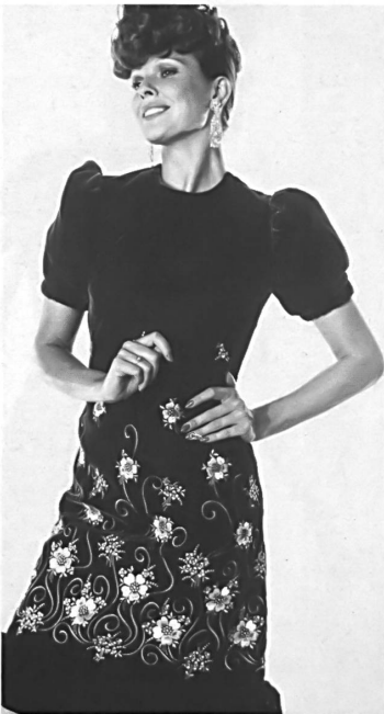
▲ JACOB ROHNER AG, REBSTEIN Saphir- blaues Samtkleid mit schöner Sticke- rei in leuchtenden Farben. — Robe de velours bleu saphir avec belle broderie en couleurs lumineuses. — Sapphire blue velvet dress with distinctive embroidery edging.