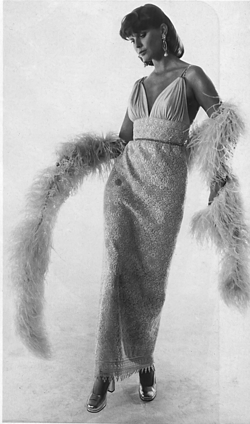
A. NAEF AG, FLAWIL Langes Abendkleid aus bunt bestickter Spachtelspitze in Samt. — Robe du soir longue en broderie multicolore, découpée, sur velours. — Long evening dress in colour-embroidered velvet cut-out lace.