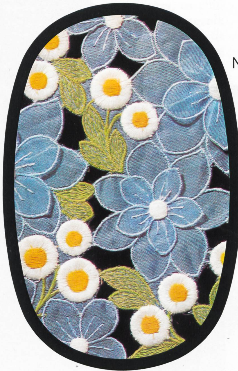
Naef ● Balmain