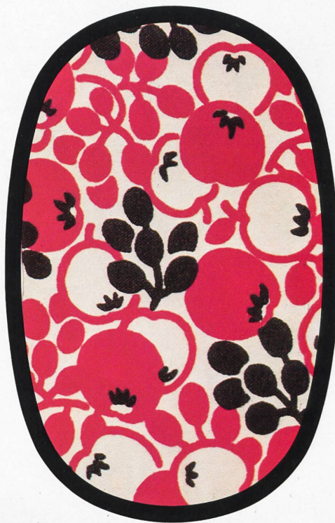
Abraham ● Dior