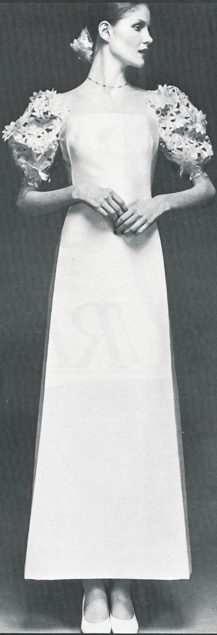
A. NAEF SA, FLAWIL ▲ Broderie découpée avec superposés. Spachtelstickerei mit Superposé-Effekten. Cut-out embroidery with superimposed.