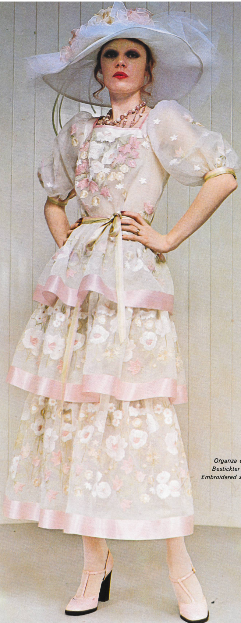
FORSTER WILLI, SAINT-GALL Organza de soie brodé et garni de rubans en satin. Bestickter Seidenorganza, mit Satinbändern verziert. Embroidered silk organza, decorated with satin ribbons.