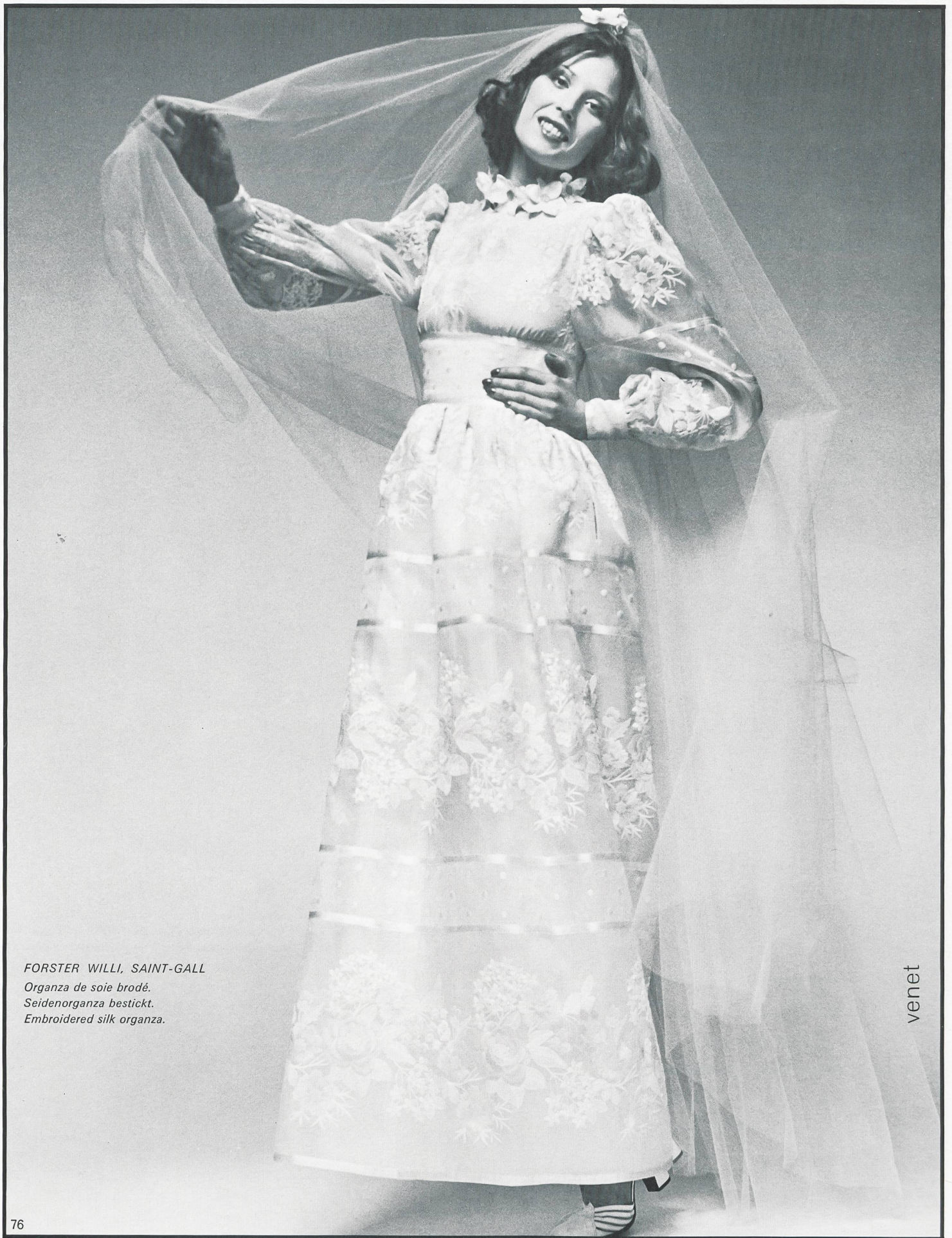
FORSTER WILLI, SAINT-GALL Organza de soie brodé. Seidenorganza bestickt. Embroidered silk organza.