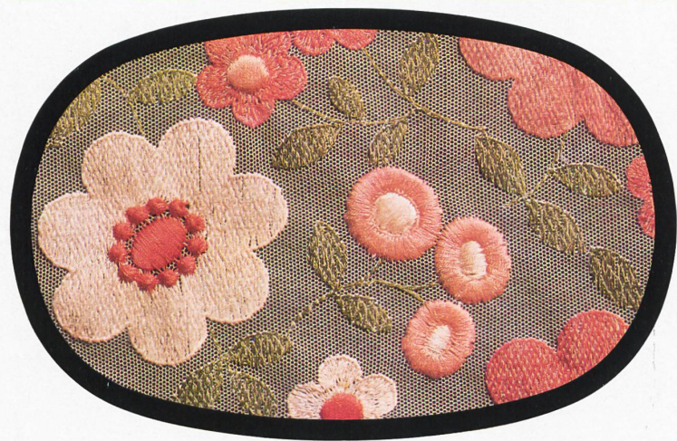
Union ● Carven