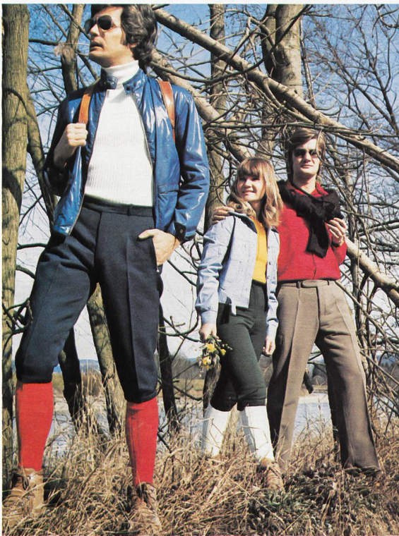
1 Elastic-Cord-Kletterhose aus Kammgarn/Nylsuisse®/Lycra®/Culotte de varappe en cordé élastique de peigné, Nylsuisse® et Lycra® / Elastic cord climbing trousers in worsted/Nylsuisse®/Lycra® (A. Huber + Sohn, Rothenthurm)

A côté de ces spécialités, le Tissage de Rothrist offre encore une collection complète d'articles pour la confection dames et messieurs, en pure laine vierge et en peigné et synthétiques tels que frescos, panamas, gabardines, serges, jeans et granités; dans ce secteur, soulignons l'importance des tissus extensibles en largeur, qui donnent aux vêtements un confort exceptionnel au porter.