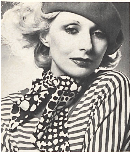
SAGER + CIE, DÜRRENÄSCH