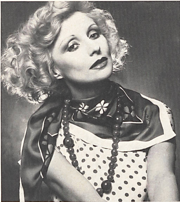
ABRAHAM AG, ZÜRICH