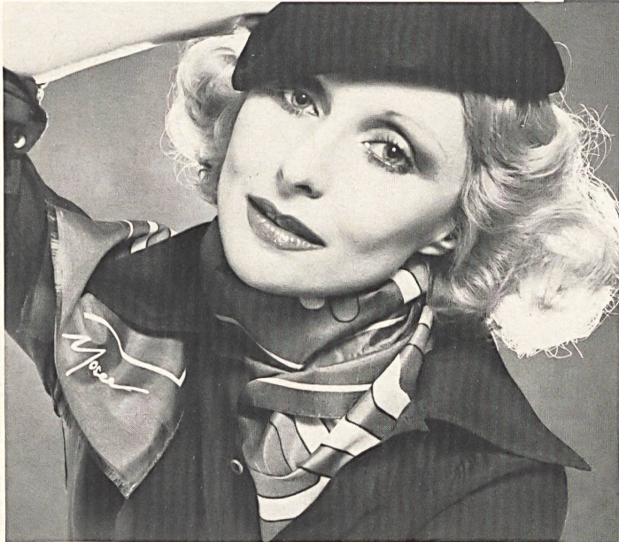
HANS MOSER + CO. AG, HERZOGENBUCHSEE