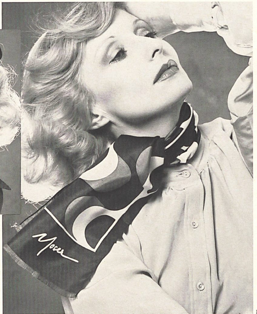
HANS MOSER + CO. AG, HERZOGENBUCHSEE