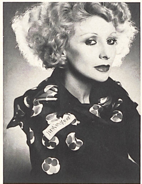
ABRAHAM AG, ZÜRICH