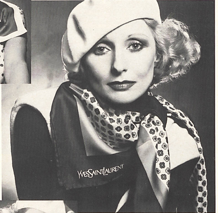
ABRAHAM AG, ZÜRICH