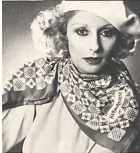
ABRAHAM AG, ZÜRICH