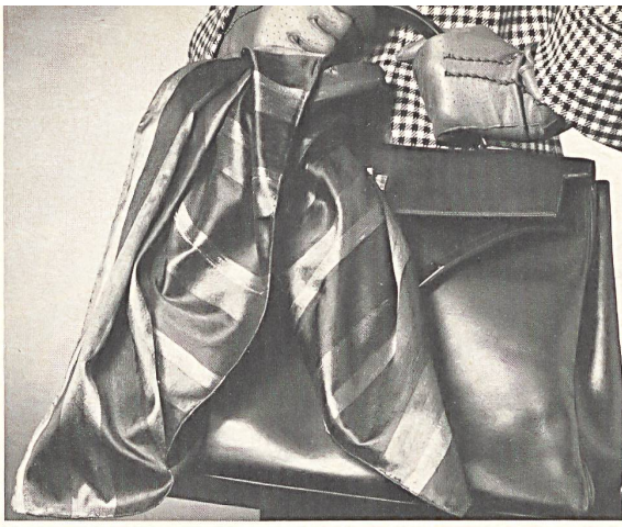
HANS MOSER + CO. AG HERZOGENBUCHSEE

What would fashion be without accessories? And accessories without squares? And, in fact, this coming season haute couture makes particularly lavish use of them, offering the fashion-conscious woman that little something with which she can vary her appearance by giving it a classical or original look according to the whim of the moment. The squares are folded into triangles, slipped conspicuously under the turned down collars of coats, suits or blouses, and loosely tied. They are used to fill boat necklines of dresses, knotted at the shoulder. They are worn peasant style around the hips, the ends left dragging to one side. For the evening, they come in the form of huge shawls, often cut out of the same fabric as the dress, and edged with fringes or ostrich feathers. Many of these squares, in silk or similar fabrics, are made in Switzerland, even when marked with the label of a fashionable couturier. Square, rectangular, triangular or long and narrow, they are often designed with the same patterns in matching colours to go with the dresses and coats. The centre usually features floral motifs, traditional ornaments or geometric designs, while the borders are set off with wide, shaded or bayadère stripes. Designers are continually on the lookout for new ways of giving an original look and fresh allure to these scarves and squares; even in the plain versions, the structure of shantung adds a luxurious look.