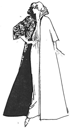
Thema « Grand Gala »: bestickter Abendmantel mit drapiertem Jersey-Kleid (Paillettenstickerei « Duchesse » von Jakob Schlaepfer + Co. AG, St. Gallen / Polyester-Jersey von Robt. Schwarzenbach + Co. AG, Thalwil)