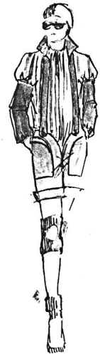
Thema « Sport »: Trägershorts mit gestreifter Bluse (Borkencrêpe « Maharani » von Mettler + Co. AG, St. Gallen / Wollgabdine von Schoeller Textil AG, Derendingen)