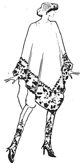
Thema « Empfang zu Hause »: enge Hose mit Umhang (Wollmousseline bedruckt von F. Blumer + Cie, Schwanden)