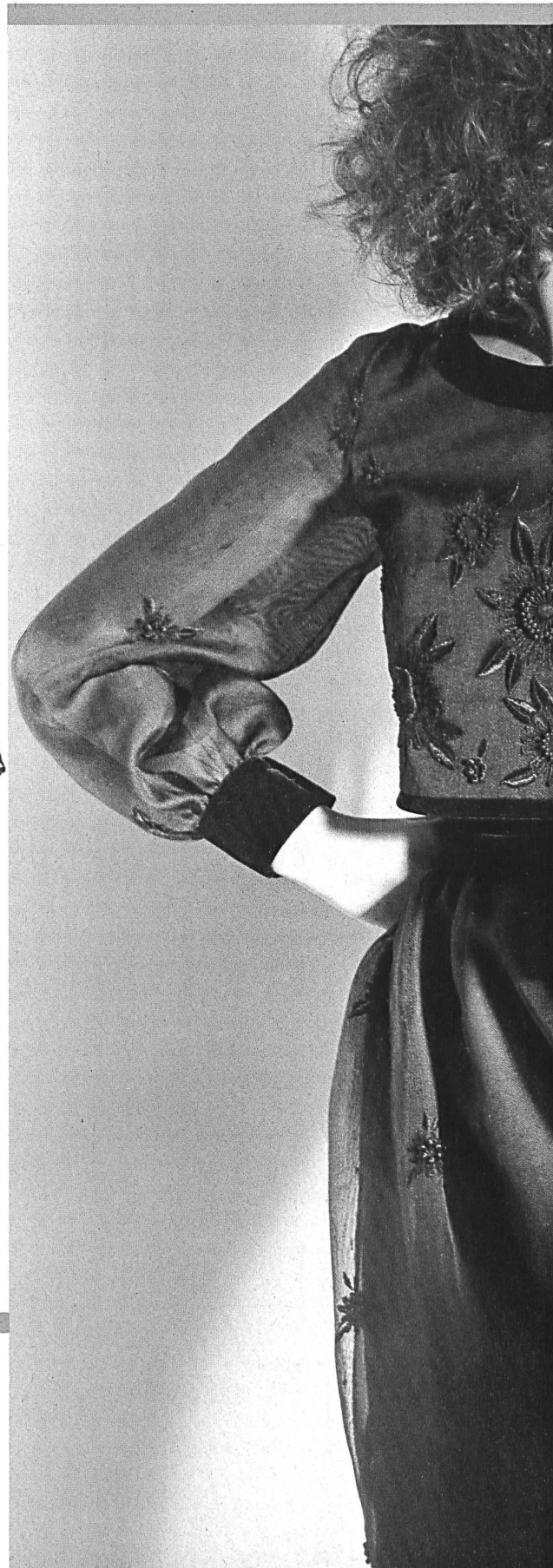
Bordure brodée, fine comme du filigrane, avec applications de guipure en noir sur tulle noir. Filigranzarte Stickereibordüre mit Ätzapplikationen in Schwarz auf schwarzem Tüll. Filigree embroidery edging with black burnt-out appliqué work on black tulle.