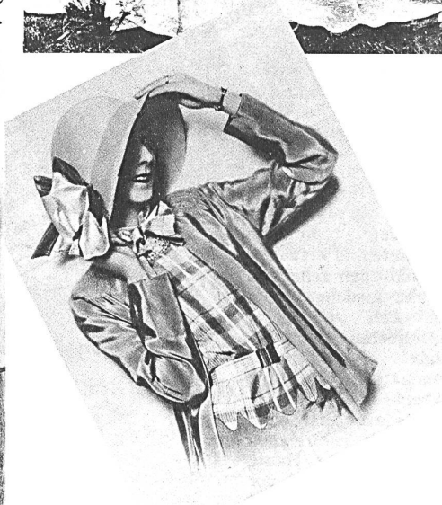
Die schweizerische Textilindustrie an der Landesausstellung, Zürich 1939. L'industrie textile suisse à l'Exposition nationale, Zurich 1939. The Swiss textile industry at the National Exhibition, Zurich 1939.