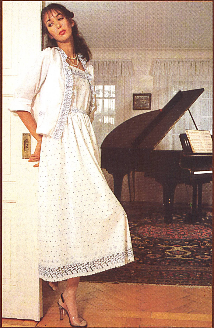
△ Farbige Richelieustickerei mit assortiertem Galon auf Baumwollbatist. Coloured Richelieu embroidery with matching braid on cotton batiste.

Die Firma Jacob Rohner AG, Rebstein, bringt ein von der Jahreszeit unabhängiges variationenreiches Stickerei-Programm, das in einzelne Themenkreise unterteilt ist. Dabei sind die verschiedenen Artikel jedes Sortimentes farblich und dessinmässig aufeinander abgestimmt: in der Kombination äusserst anregend, in der Verarbeitung für den Konfektionär völlig problemlos. Eine grosse Gruppe ist der Richelieustickerei nachempfunden mit ausgeprägtem Handarbeitscharakter, wobei die Dessins der Nouveautés von den Allovers mit Bordürenabschluss über Volants, Bänder und Galons in verschiedenen Breiten bis zu den Taschen und Einsätzen entweder Ton-in-Ton auf rustikalem Baumwolltoile oder farbig auf Baumwollbatist gestickt sind. Eine weitere Spezialität ist Richelieustickerei auf Baumwoll-Cretonne