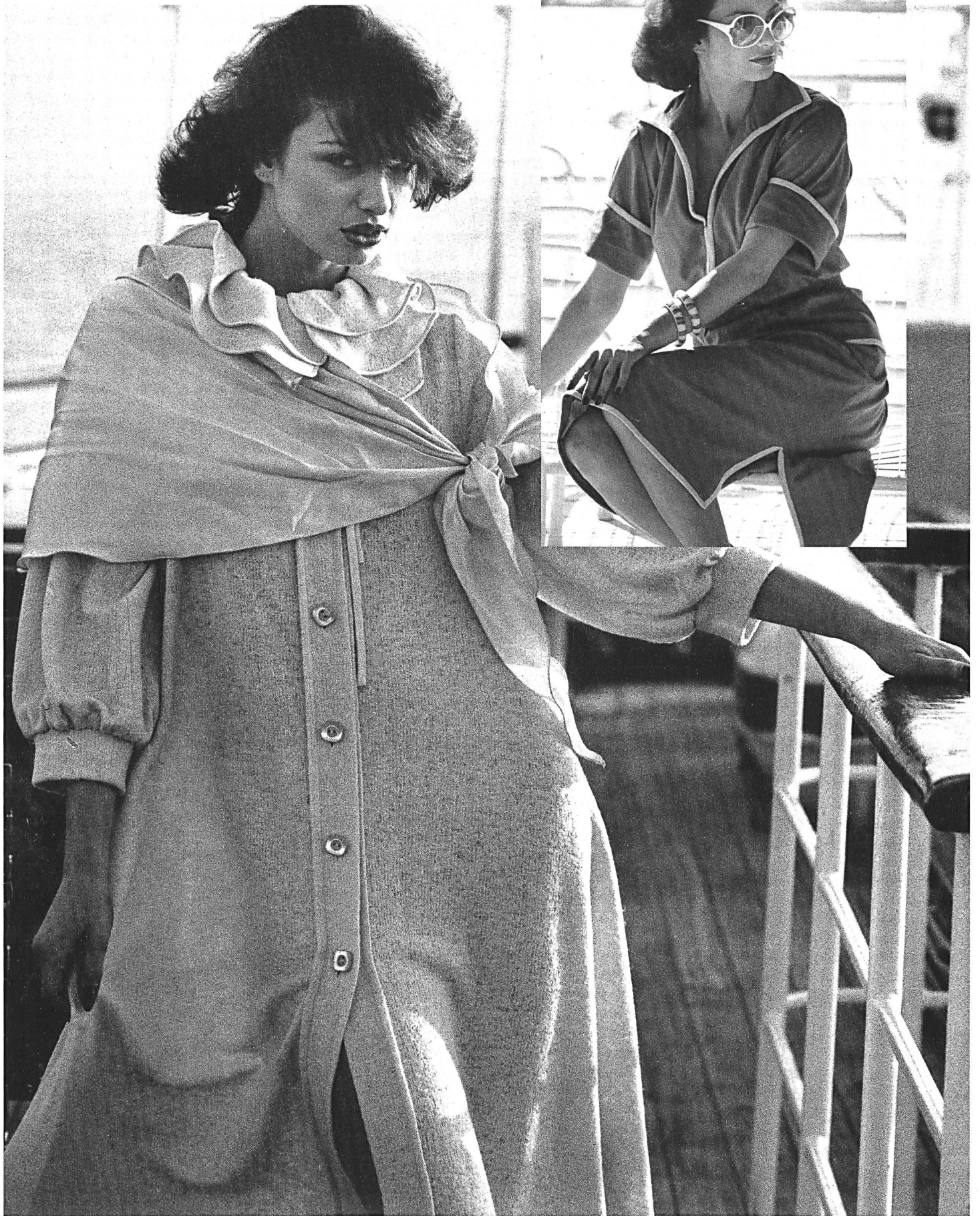
GUGELMANN, LANGENTHAL Maschenstoff aus Seide und Boucléwolle. (Mariella Ami, Rom)