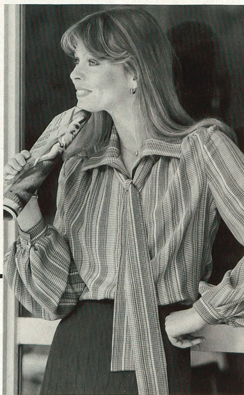
△ Reinseiden-Crêpe de Chine / Crêpe de Chine pure soie / Pure silk crêpe de Chine. (Metzler, St. Gallen)