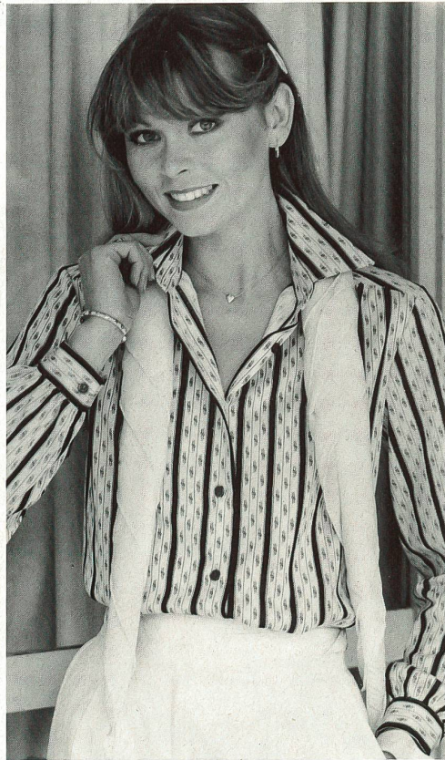
△ Baumwolljersey «Bari» / Jersey de coton «Bari» / "Bari" cotton jersey.