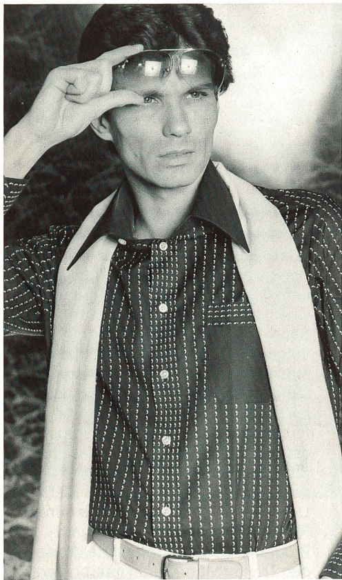
Baumwollbatist «Stromboli» / Batiste de coton «Stromboli» / "Stromboli" cotton batiste.