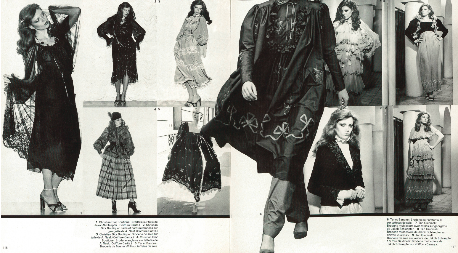
1 Christian Dior Boutique: Broderie sur tulle de Jakob Schlaepfer. (Coiffure Carita.) 2 Christian Dior Boutique: Laize et bordure brodées sur georgette de A. Naef. (Coiffure Carita.) 3 Christian Dior Boutique: Broderie de soie sur tulle de A. Naef. (Coiffure Carita.) 4 Christian Dior Boutique: Broderie anglaise sur taffetas de A. Naef. (Coiffure Carita.) 5 Ter et Bantine: Broderie de Forster Willi sur taffetas de soie.

des palotots et des pardessus, ils interprètent une ligne nettement masculine, avec des manteaux de style officier, ils adhèrent à la ligne militaire stricte. En revanche, des manteaux enveloppants à col châle donnent une note douce et féminine. Les tissus préférés pour les manteaux sont des cirés brillants, des réversibles à extérieur hydrofugé et intérieur chaud, de douillets moirés, des tweeds, des draps de laine, du lama, du cachemire et des matelassés.