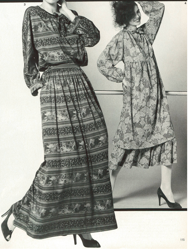
1 + 2 Devernois: Jersey de laine « Milena » imprimé de Christian Fischbacher. 3 Korrigan: Jersey de coton « Amia » de Mettler. 4 Rodier: Mousseline de laine « Ténia » de Mettler. (Coiffures: Cédric pour Maurice Profit.)