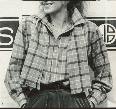
1 Ter et Bantine: Broderie multicolore sur tulle de Forster Willi. 2 Gudule: Broderie sur tulle de Forster Willi. 3 Rousseau: Jersey de coton de Mettler. 4 Jean Kolpa: Tissue laine «Lanella» de Hausmann + Moos.