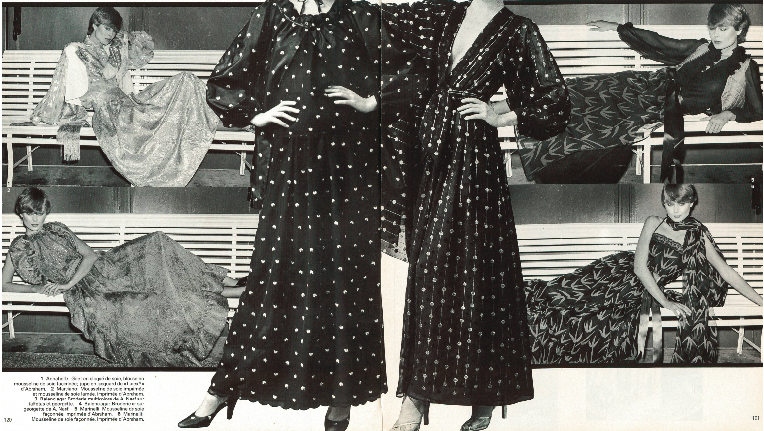
1 Annabelle: Gilet en cloqué de soie, blouse en mousseline de soie façonnée; jupe en jacquard de «Lurix®» d'Abraham. 2 Marciano: Mousseline de soie imprimée et mousseline de soie lamée, imprimée d'Abraham. 3 Balenciaga: Broderie multicolore de A. Naef sur taffetas et georgette. 4 Balenciaga: Broderie or sur georgette de A. Naef. 5 Marinelli: Mousseline de soie façonnée, imprimée d'Abraham. 6 Marinelli: Mousseline de soie façonnée, imprimée d'Abraham.

de laine fluides et de flattereurs velours, en noir, rouge feu, bleu canard, parme, fuchsia et violet confirment l'impression que la mode « discothèque », venant de New York, a atteint l'Europe. Sportive et fonctionnelle le jour, sexy, raffinée et fantaisiste le soir, c'est ainsi que la nouvelle mode correspond exactement à la psychologie de la femme moderne qui voudrait être tout à la fois énergique, active, féminine et sexy.