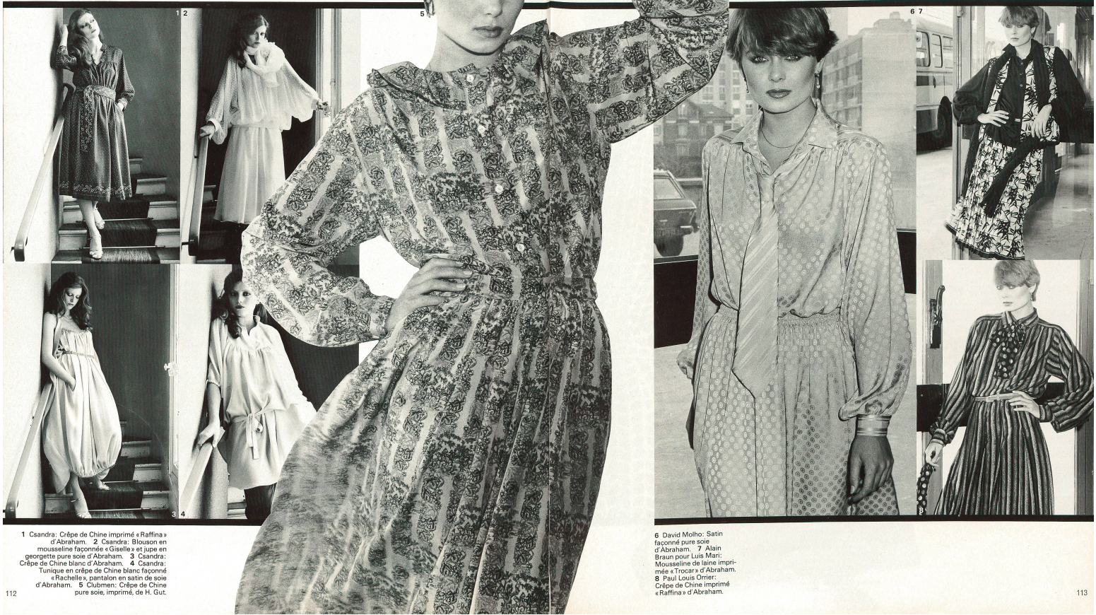
1 Csandra: Crêpe de Chine imprimé « Raffina » d'Abraham. 2 Csandra: Blouson en mousseline façonné « Giselle » et jupe en georgette pure soie d'Abraham. 3 Csandra: Crêpe de Chine blanc d'Abraham. 4 Csandra: Tunique en crêpe de Chine blanc façonné « Rachelle », pantalon en satin de soie d'Abraham. 5 Clubmen: Crêpe de Chine pure soie, imprimé, de H. Gut.

noir, les costumes « futuristes » du nouveau film de SF « La Guerre des Étoiles ». Mais l'élément essentiel de la nouvelle mode d'hiver est un style militaire qui, dans les collections des jeunes stylistes d'avant-garde, a provoqué la stupefaction. Leurs manteaux, jaquettes et tailleurs pourraient être tirés d'un album d'uniformes et, au premier abord, ils ont suscité un certain étonnement. Mais si l'on fait abstraction de tous les accessoires « guerriers » tels que cein-