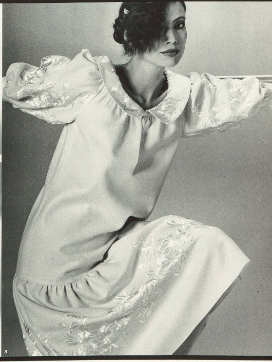
1 Ted Lapidus International: Broderie chimique de A. Naef. (Coiffure: Cédric pour Maurice Profit.) 2 Issey Miyake: «Feather-Cords» de Mettler-Teamtex. (Chapeau: Jean Barret; chaussures: Stéphane Kilian.) 3 Ted Lapidus International: Broderie sur flanelle «Volaba» de Jakob Schlaepfer. (Coiffure: Cédric pour Maurice Profit.)