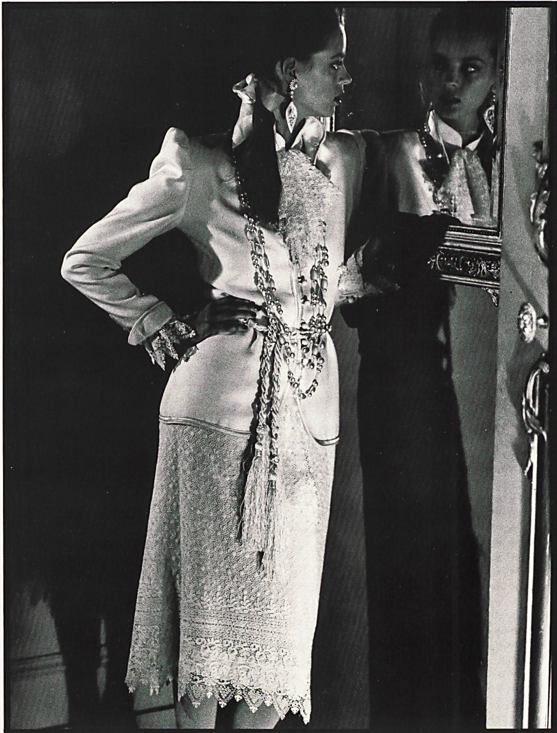
Cet ensemble exprime tout le charme de la splendeur coloniale britannique. Le bord artistement traité de la fine guipure ivoire est répété aux manches. La lavallière est de la même broderie.