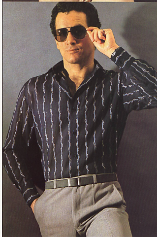
«Andrea», Baumwoll-Vollvoile bedruckt / voile véritable de coton, imprimé / cotton full voile print.