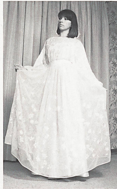
◁◁ J.G. NEF-NELO AG, HERISAU Striped embroidery with rich openwork on polyester-crêpe georgette / Streifenstickerei mit reicher Durchbrucharbeit auf Polyester-Crêpe Georgette / Rayures brodées sur georgette de polyester avec effets de jours. (Chessa e Bruno, I-Milano) ◁