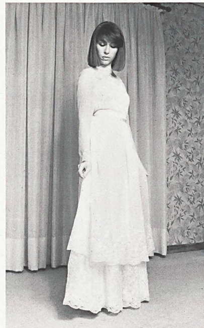
◁◁ J.G. NEF-NELO AG, HERISAU Embroidery on polyester- crêpe georgette / Stickerei auf Polyester-Crêpe Georgette / Broderie sur georgette de polyester. (Chessa e Bruno, I-Milano)