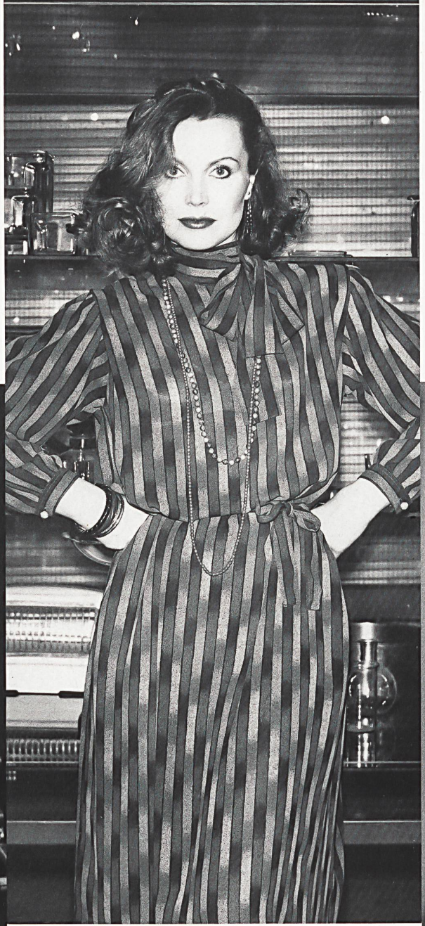
△ E. SCHUBIGER + CO. AG, UZNACH Deux-pièces avec jupe plissée en crêpe de Chine façonné, pure soie / Deux-pièces mit plisziertem Rock aus Crêpe de Chine façonné, reine Seide / Two-piece outfit with pleated skirt in pure silk figured crêpe de Chine.