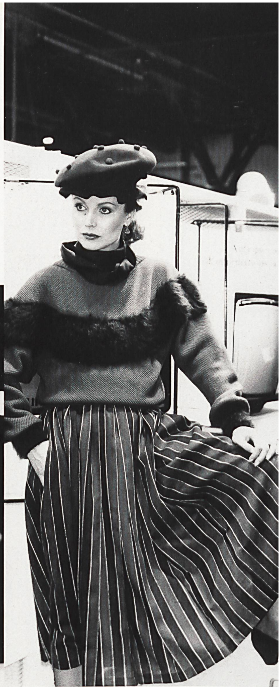
△ WEISBROD-ZÜRRER AG, HAUSEN AM ALBIS Robe en crêpe de viscose avec bordures imprimées / Bordürenkleid aus bedrucktem Viscose-Crêpe / Viscose crêpe dress with printed edgings. PAULETTE BURAUD