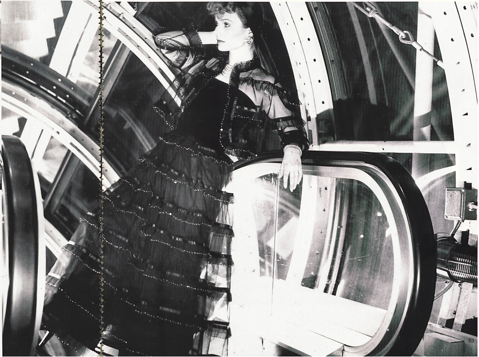
UNION AG, ST. GALLEN Robe du soir avec jaquette en tulle richement orné de ruchés et d'applications de velours et de strass / Abendrobe mit Jacke aus reich mit Rüschen, Samt- und Strass-Applikationen verziertem Tüll / Evening dress with tulle jacket richly decorated with ruching, velvet and rhinestone applications. STARA