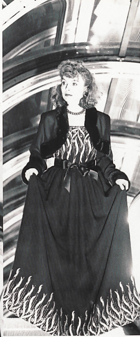
UNION AG, ST. GALLEN Robe du soir avec broderie soie et Lurex® en bordure / Abendkleid mit bestickter Seiden/Lurex®-Bordüre / Evening dress with embroidered silk/Lurex® edging. LORENZO RIVA POUR BALenciAGA