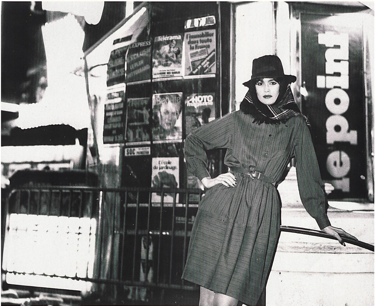
CHR. FISCHBACHER CO. AG, ST. GALLEN Robe de jour, longueur mode, en mousseline de laine rayée / Tageskleid in modischer Länge aus gestreiftem Woll-Mousseline / Fashionable length day dress in striped wool mousseline. ROBERT NELISSEN ▽