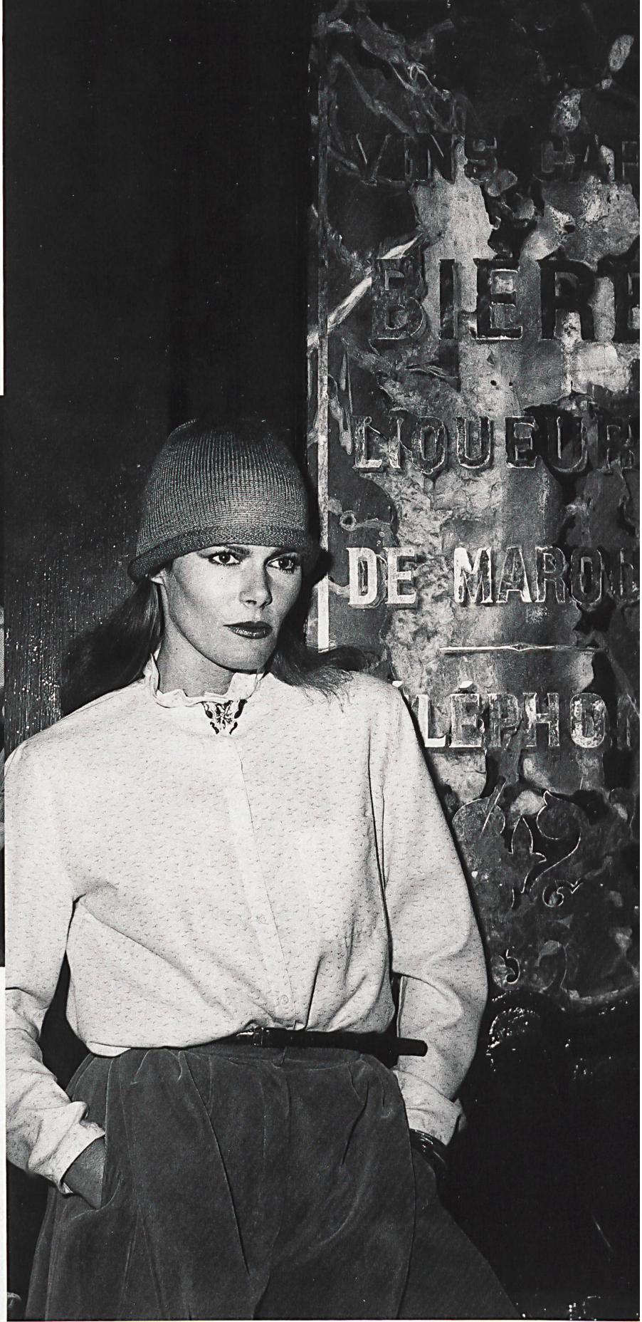
△ METTLER+CO. AG, ST. GALLEN Blouse asymétrique en crêpe de Chine de polyester / Asymmetrische Bluse aus Crêpe de Chine, Polyester / Asymmetrical blouse in polyester crêpe de Chine. PÉROCHE