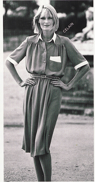
WEISBROD-ZÜRRER AG. Hausen am Albis ◄ Elegante robe-chemisier en crêpe de polyester avec incrustations de couleur contrastante / Elegantes Chemisier-Kleid aus Polyester-Crêpe mit kontrastfarbigen Blenden / Elegant shirtwaister dress in polyester crêpe with trimmings in contrasting colours. Δ Pimpante robe-chemisier en crêpe de polyester avec garnitures blanches / Polyester-Crêpe für adrettes Chemisier-Kleid mit weissem Ausputz / Polyester crêpe for pretty shirtwaister dress trimmed with white.