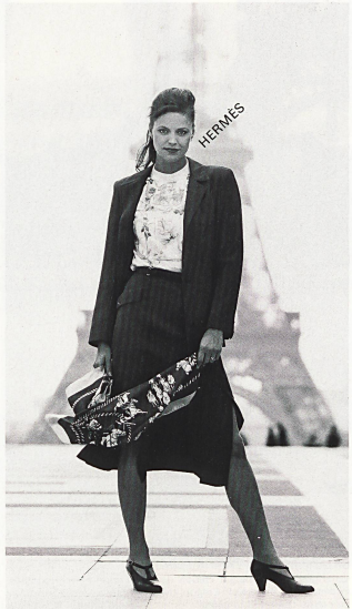
TACO AG, Glöttbrugg ◁ Tailleur en tissus combinés fibranne type lin «Asiatique», imprimé à rayures pour la jaquette et uni pour la jupe, porté avec une blouse en voile de coton imprimé «Silhouette» / Kombikostüm in Zellwolle/Leinen «Asiatique» mit Streifendruckdessin (Jacke) und Uni-Composé (Jupe). Dazu, Imprimé-Bluse aus Baumwoll-Voile «Silhouette» / Combisuit in spun rayon/linen "Asiatique" with printed striped design (jacket) and plain-patterned (skirt). Printed blouse in cotton voile "Silhouette".