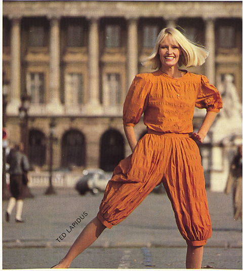
HAUSAMMANN + MOOS AG, Weisslingen Δ Knickers mode et haut en crêpe de coton «Ondor» / Modische Knickers und Top in reiner Baumwoll-Crêpe «Ondor» / Fashionable knickers and top in pure cotton crêpe "Ondor". ◁ Ample cape en tissu «Tamara Enduit», pur coton tissé en couleurs / Grosszügiges Cape aus buntgewebter reiner Baumwolle «Tamara Enduit» / Ample cape in colour-woven pure cotton "Tamara Enduit".