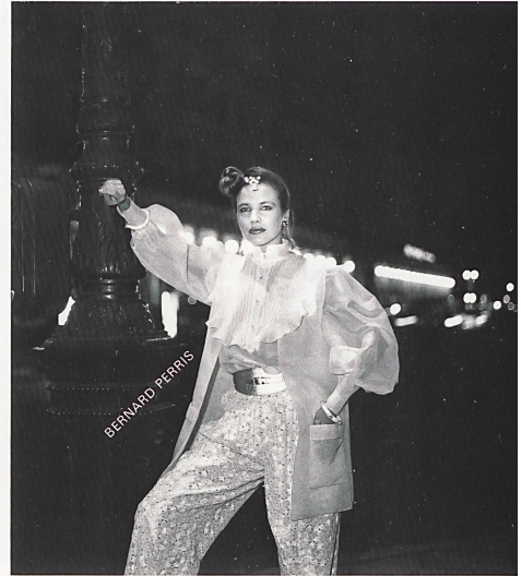
E. SCHUBIGER + CO. AG, Uznach Δ Petites merveilles textiles pour le soir: blouse en crêpe de Chine pure soie / Textile Kostbarkeiten zu nächtlicher Stunde: Bluse aus reinseidener Crêpe de Chine / Textile masterpieces for evening wear: Blouse in pure silk crêpe de Chine FORSTER WILLI + CO. AG, St. Gallen Pantalon en broderie découpée sur organza / Hose aus Spachtelspitze auf Organza / Trousers in cut-out embroidery on organza E. SCHUBIGER + CO. AG, Uznach ◁ Riche blouse volante et cape en georgette pure soie / Üppige Volant-Bluse und Cape aus reiner Seiden-Georgette / Luxuriant flounced blouse and cape in pure silk georgette.