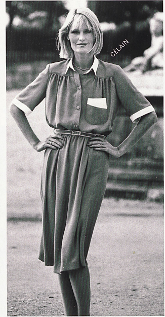
WEISBROD-ZÜRRER AG. Hausen am Albis ◄ Elegante robe-chemisier en crêpe de polyester avec incrustations de couleur contrastante / Elegantes Chemisier-Kleid aus Polyester-Crêpe mit kontrastfarbigen Blenden / Elegant shirtwaister dress in polyester crêpe with trimmings in contrasting colours. Δ Pimpante robe-chemisier en crêpe de polyester avec garnitures blanches / Polyester-Crêpe für adrettes Chemisier-Kleid mit weissem Ausputz / Polyester crêpe for pretty shirtwaister dress trimmed with white.