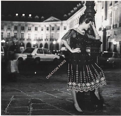
HENRY FERBER AG, St. Gallen △ Riche brodée de St-Gall avec applications de faux diamants / Reiche St. Galler Stickerei auf Tüll mit Simili-Diamant-Applikationen / Rich St. Gall embroidery on tulle with imitation diamond applications. E. SCHUBIGER + CO. AG, Uznach ▷ Songe d'une nuit d'été en taffetas pure soie / Ein Sommernachtstraum in Reinseiden-Taft / A midsummer night's dream in pure silk taffeta.