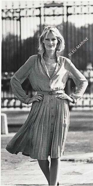
METTLER + CO. AG. St. Gallen Δ Robe-chemisier, entièrement boutonnée, en georgette de polyester; dessin original «Naomi» / Durchgeknapptes Chemisier-Kleid aus Polyester Crêpe-Georgette. Exklusiv-Dessin «Naomi» / Button-through shirtwaister dress in polyester crêpe georgette. Exclusive Design "Naomi".