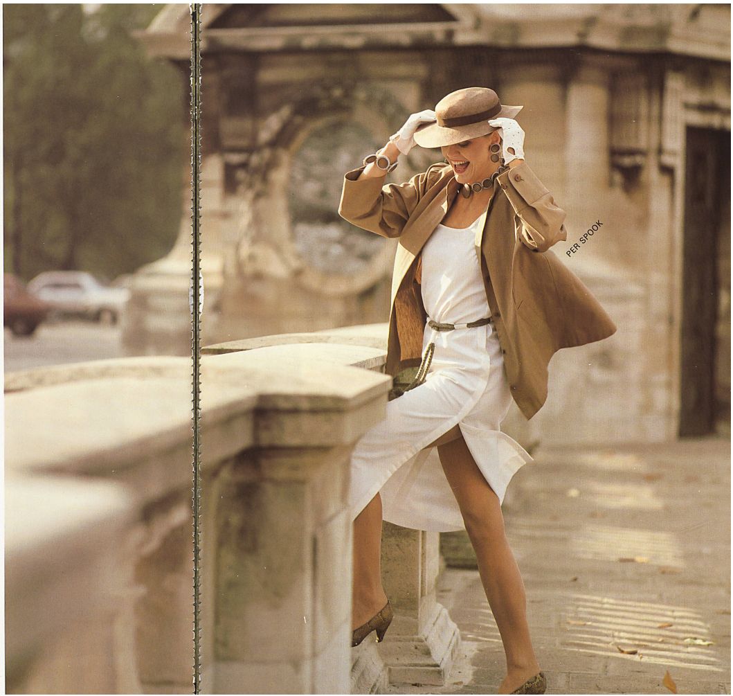
HAUSAMMANN + MOOS AG, Weisslingen Δ Jupe ondoyante en pur coton imprimé «Palma» / Beschwingter Imprimé-Rock in reiner Baumwolle «Palma» / Printed skirt with floating panels in pure cotton «Palma» ▷ Robe-tunique fendue haut et jaquette, en coton et lin / Hochgeschlitztes Tunika-Kleid und Jacke aus Baumwolle/Leinen / Deeply slit tunic dress and jacket in cotton/linen.