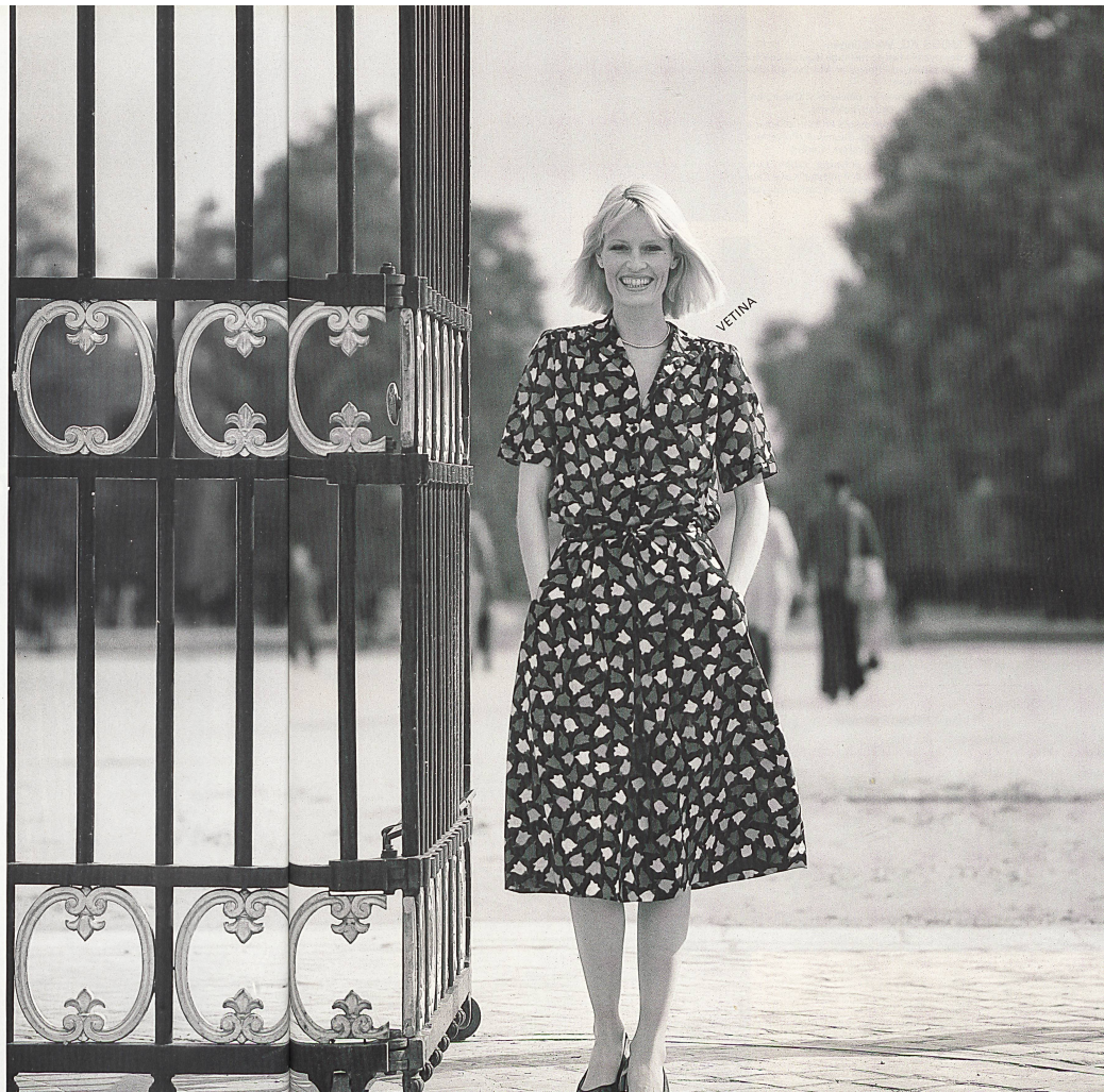
TACO AG. Glattbrugg ▷ Dessin imprimé en fuchsia, mauve et divers tons de jaune sur fibranne type lin «Asiatique» pour la jupe et sur voile de coton «Silhouette» pour la blouse / Imprimé-Dessin in Fuchsia-, Lila- und Gelbtönen auf Zellwoll/Leinen «Asiatique» für den Rock, auf Baumwoll-Voile «Silhouettes» für die Bluse / Printed design in fuchsia, lilac and yellow tones on spun rayon/linen "Asiatique" for the dress, on cotton voile "Silhouette" for the blouse.