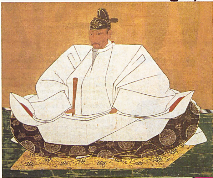
Wandbehang. Portrait von Hideyoshi, auf Seide gemalt. 1600.