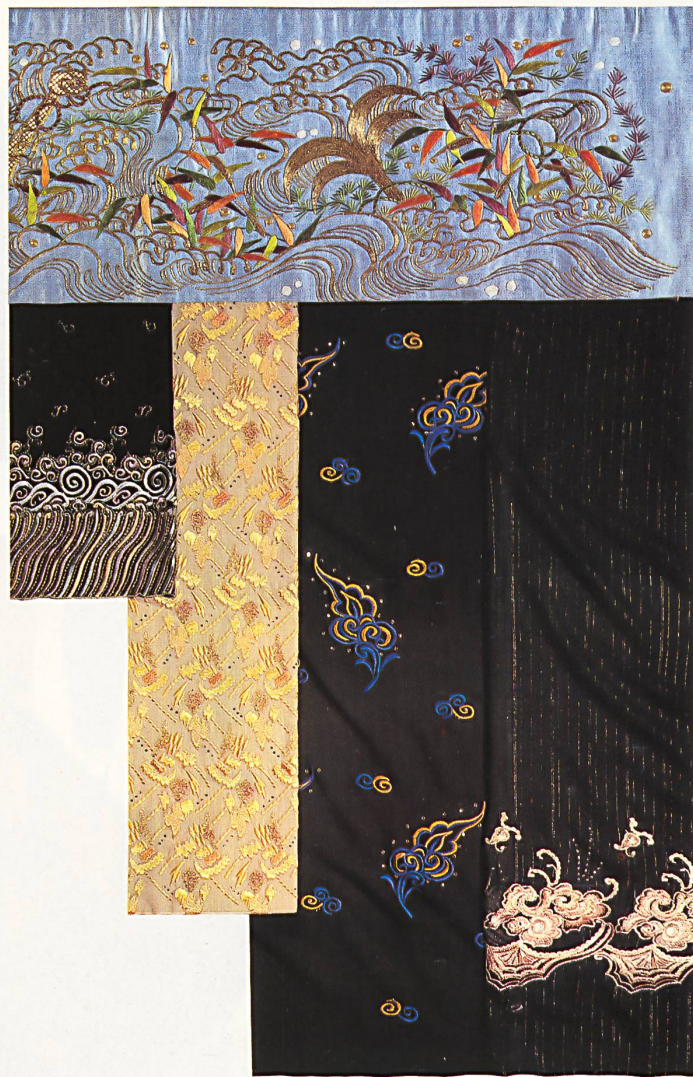
△ Katsugi (Überwurf, der auch den Kopf bedeckt) in Leinen aus der späten Edo-Periode (1800–1868). Grosszügige Dessins mit bewegten Formen, oft als Kombination von floralen und grafischen Motiven, nicht selten auch asymmetrisch angeordnet, sorgen für höchst dekorative Wirkung der Kimonos. Reicher, bewegter Panneauxdruck auf Baumwoll-Georgette von Taco AG, Glattbrugg-Zürich .