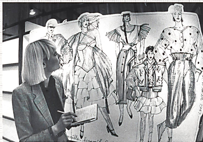
Die vielbeachteten Farb- und Stoffthemen des Interstoff Trendset-Centers wurden erstmals durch Styling-Ideen ergänzt.

Äusserst lebhaft ging es auch auf dem Gemeinschaftsstand der Swiss Fabric Export Group zu und her. Bereits zum vierten Mal präsentierten 42 Firmen der Schweizer Textilindustrie unter der Flagge «SWISS FABRIC» rund 1200 Mustercoupons von modischen Geweben, Gewirken und Stickereien sowie nahezu 250 aufgemachte Garn- und Zwirnmuster. Aus den rund 950 Standbesuchen resultierten 610 Geschäftsverbindungen, wobei die vermehrt gezielten und konkreten Anfragen der Standbesucher eine Reihe direkter Geschäftsvermittlungen ermöglichten. Dabei leisteten die verschiedenen zur Abgabe aufliegenden «SWISS FABRIC»-Dokumentationen, insbesondere das neue «Directory» des Vereins Schweizerischer Textilindustrieller (VSTI), wertvolle Dienste.