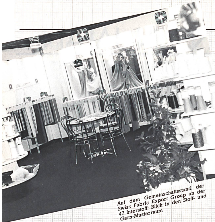
Auf dem Gemeinschaftsstand der Swiss Fabric Export Group an der 47. Interstoff: Blick in den Stoff- und Garn-Musterraum

... und in eine der 20 vielbeachteten Schaufenstertvitrinen.