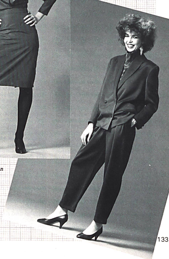
Taft von AG Stünzi Söhne, Horgen (Modell Pink Flamingo).