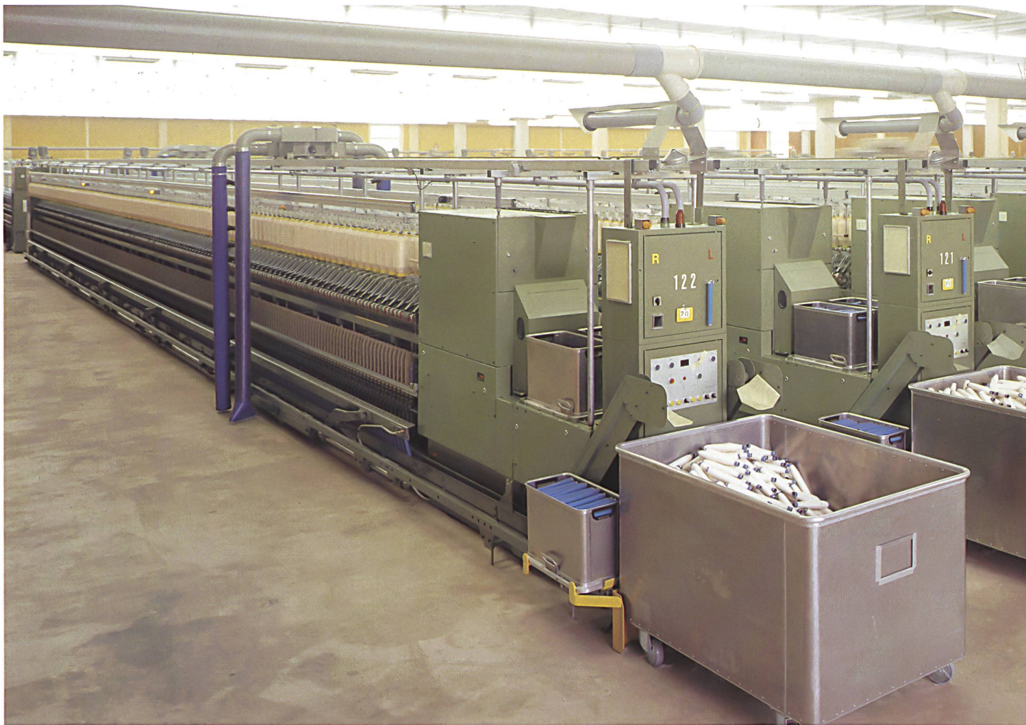
Der riesige Saal mit den vollautomatischen Ringspinnmaschinen ist eine der modernsten Anlagen, die heute existieren.

Im 1981 erstellten Lagerhaus ist ein Vorrat von 2500 t extralangstapiger Baumwolle untergebracht. Um das Brandrisiko zu limitieren, ist der Kubus des Baues in vier völlig getrennte Kammern unterteilt, die mit neusten Feuermeldeanlagen ausgerüstet sind. Besonders konzipierte Lichtkuppeln würden bei einem Brandausbruch dafür sorgen, dass die entstehenden