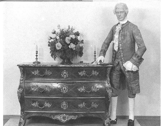
Oben v.l.n.r.: Sandfarbenes Seidendamastkleid, um 1760 / Brautkleid aus weisser, bunt broschierter Taftseide, um 1770, aus Graubünden / Zweiteiliges Damenkleid aus gestepptem, gelbem Seidentaft, Herrenanzug aus gelber Ripsseide. Beide um 1770 / Herrenanzug aus blauer Moiréseide, um 1780.