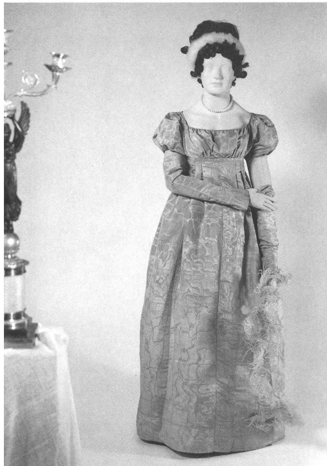
Ballkleid aus rosa Moiréseide, gegen 1820.

wochenlange minutiöse Instandstellung im Restaurationsatelier des Landesmuseums. Als ein Glücksfall erwies sich auch ein Grabfund aus der Peterskirche in Zürich, anhand dessen sich herausstellte, dass Männer im 18. Jahrhundert in seidenen kaftanähnlichen Hauskleidern begraben wurden. Obwohl sie unansehnlich braun geworden waren, konnten einige dieser Gewänder rekonstruiert und restauriert werden. Es kommt allerdings auch immer wieder vor, dass ursprünglich interessante Stücke nicht in die Sammlung aufgenommen werden, weil sie durch Beschädigung oder mehrfache Abänderung ihre Aussagekraft eingebüsst haben und als Dokumentation einstiger Kleidersitten nicht mehr taugen.