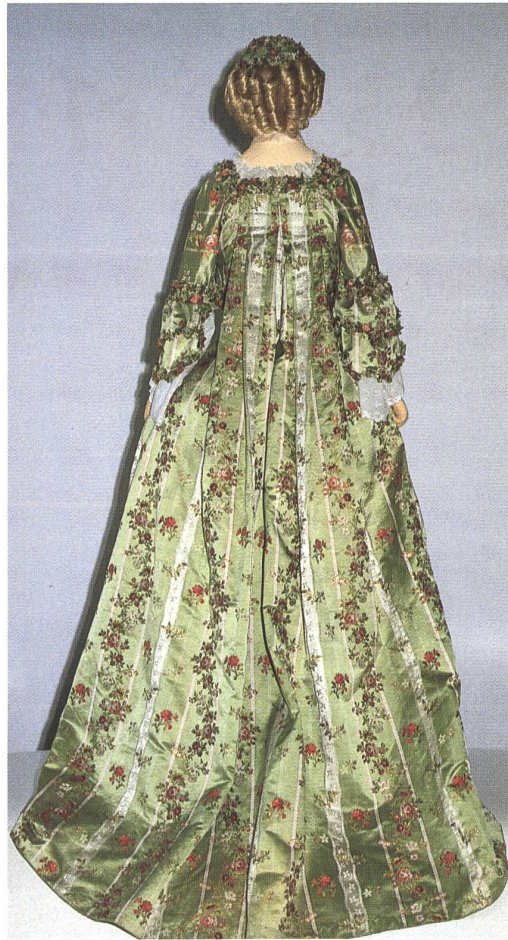
Damenrobe aus Atlasseide mit broschierten Blumenbouquets, um 1775.