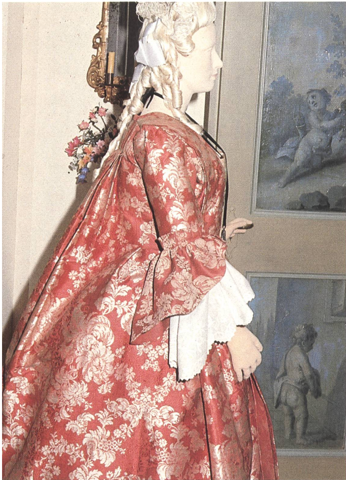
Damenrobe aus broschierter Seide, um 1760.

Das älteste Damenkleid datiert von ca. 1700 und ist aus schwarzem Wollstoff gearbeitet, der im damaligen puritanischen Zürich für den Kirchgang als einzig schicklich galt. Auch für Männerkleidung gibt es keine früheren Beispiele, nur unter den Kindersachen finden sich einige gestickte Kleider aus dem 17. Jahrhundert. Eines der jüngsten Objekte ist ein Original-Balenciaga-Modell, doch bildet es