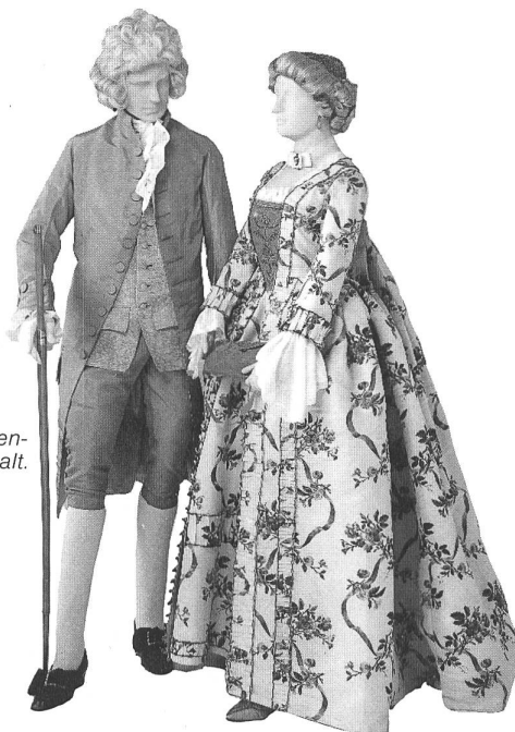
Herrenanzug in rosa Ripsseide, Damenrobe aus weisser Ripsseide, bunt bemalt. Um 1775.