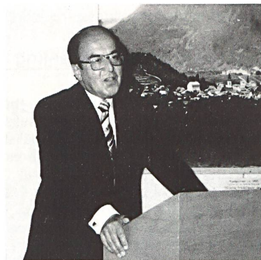
Bundesrat Dr. Kurt Furgler, Vorsteher des Eidg. Volkswirtschaftsdepartementes