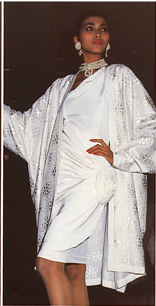
CARVEN Broderie soie sur crêpe de soie. Silk embroi- dery on silk crêpe.