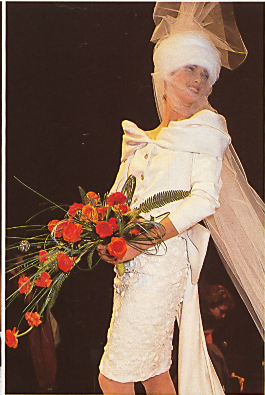
LECOANET HEMANT Broderie en coton, géné- reusement découpée. Rich cut-out cotton embroidery.