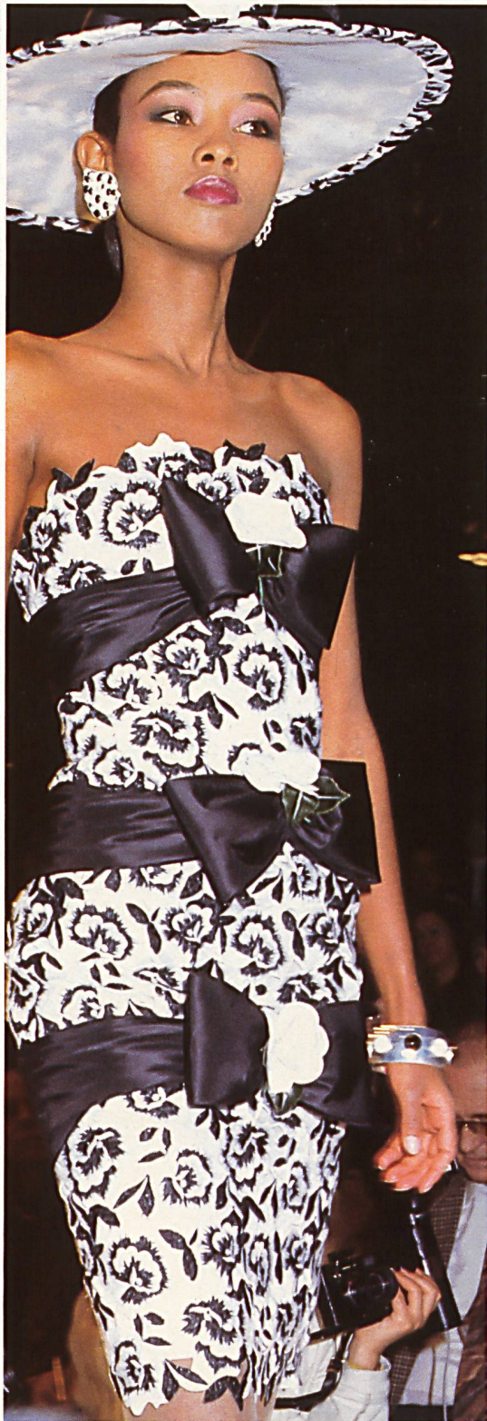
GIVENCHY Broderie découpée, bicolore. Two-tone cut-out embroidery.