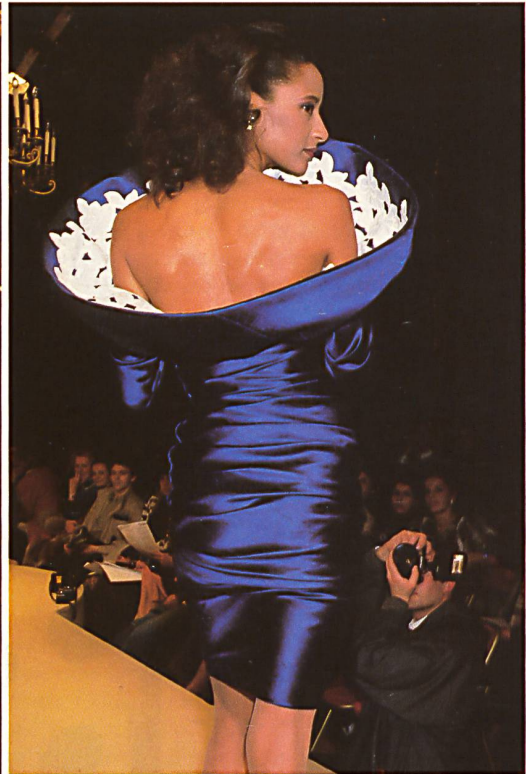
LECOANET HEMANT Chintz brodé et découpé. Embroidered cut-out chintz.