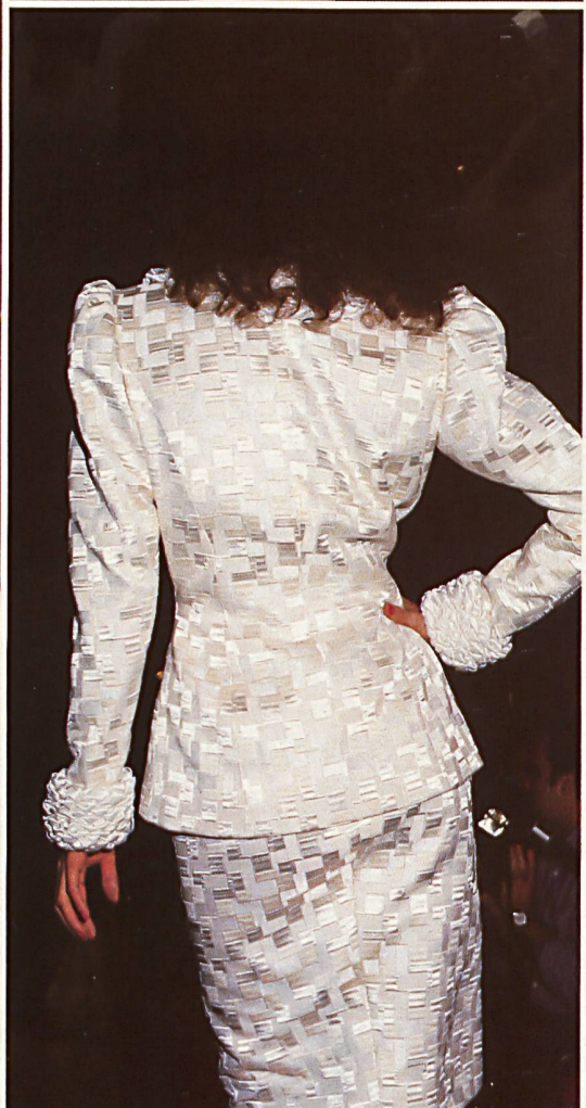
CARVEN Broderie soie et coton sur satin de soie. Silk and cot- ton embroi- dery on silk satin.