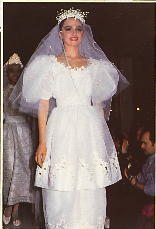
CARVEN Application de chintz sur organdi brodé coton. Chintz appli- cation on em- broidered cot- ton organdy.