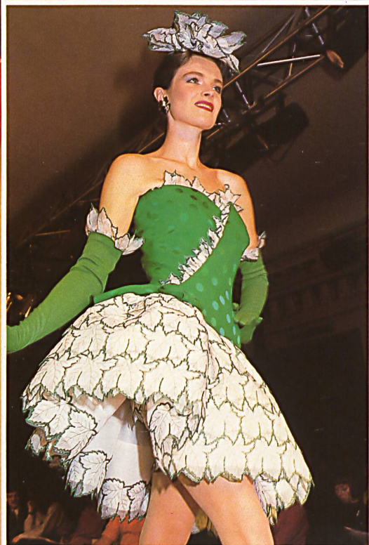
LEPAGE Broderie superposée sur organza de soie. Embroidery overlay on silk organza.