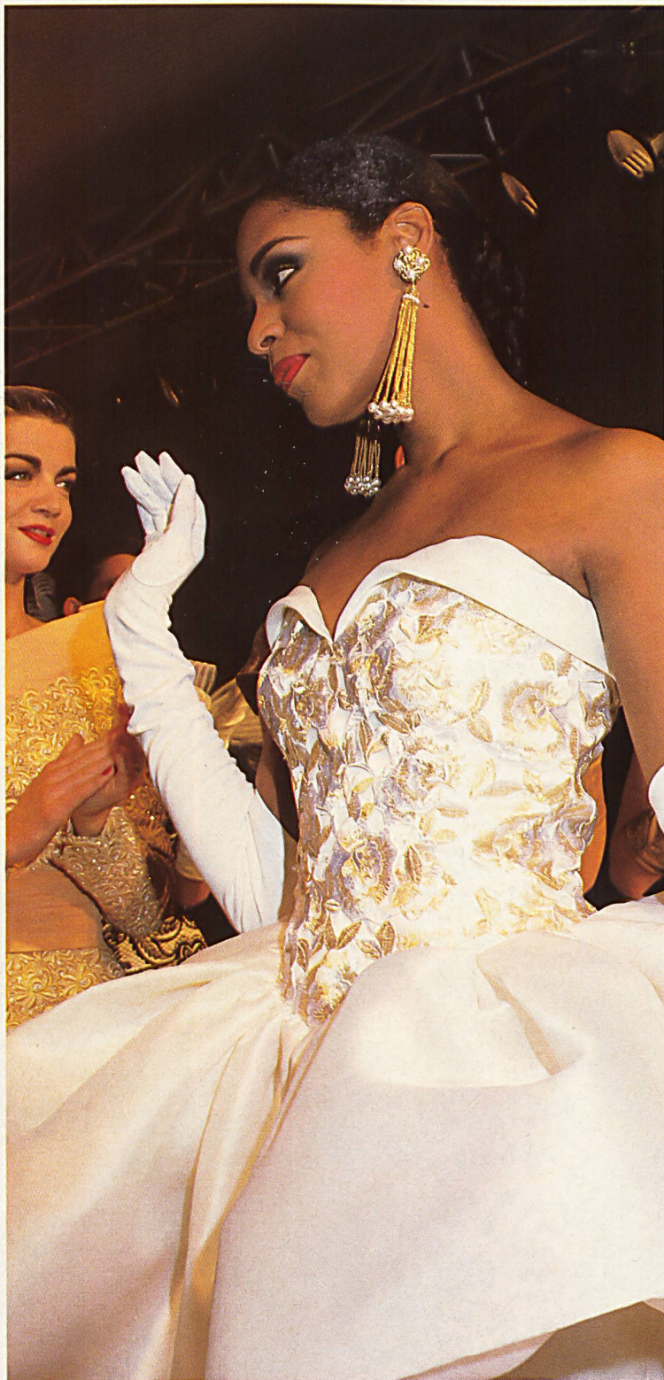
LEPAGE Broderie découpée, bicolore. Two-tone cut-out embroidery.