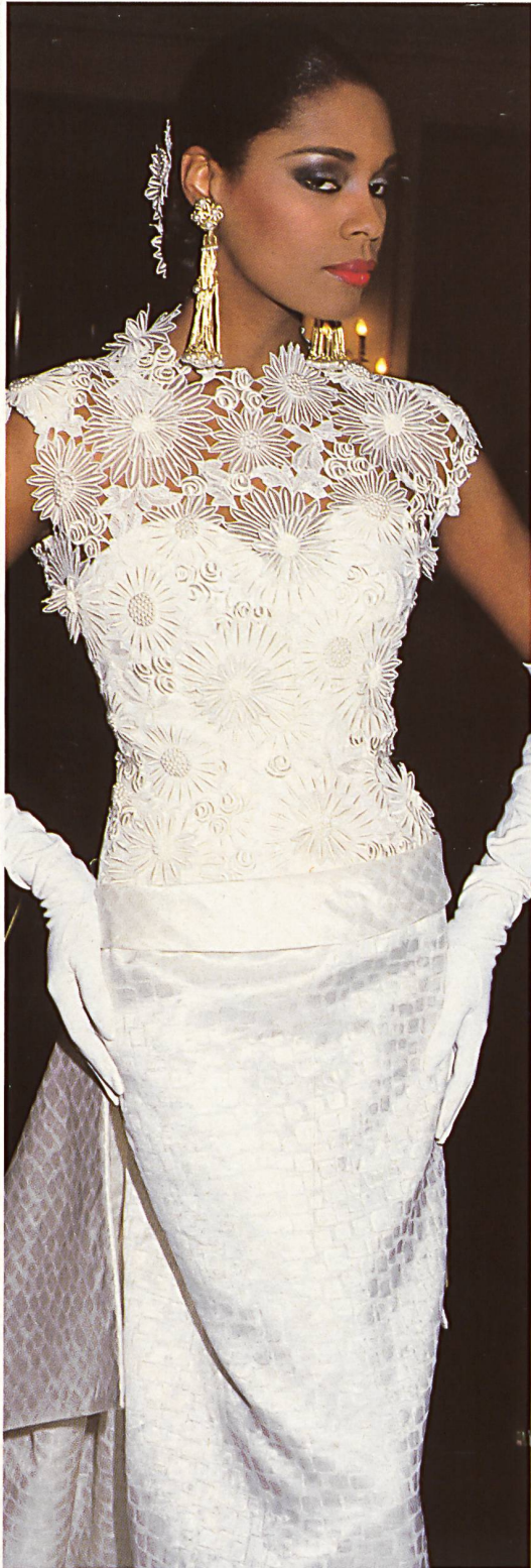
LEPAGE Broderie découpée enrichie de perles. Rich cut-out embroidery with pearls.