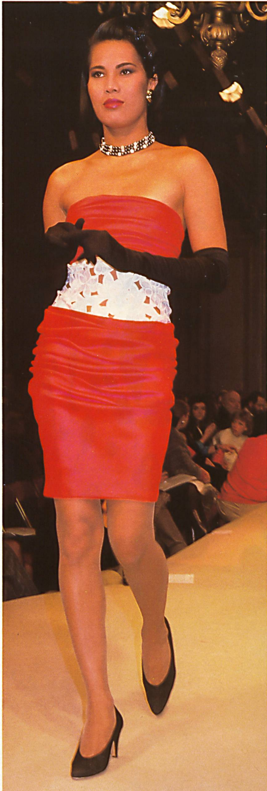
LECOANET HEMANT Chintz brodé et découpé. Embroidered cut-out chintz.