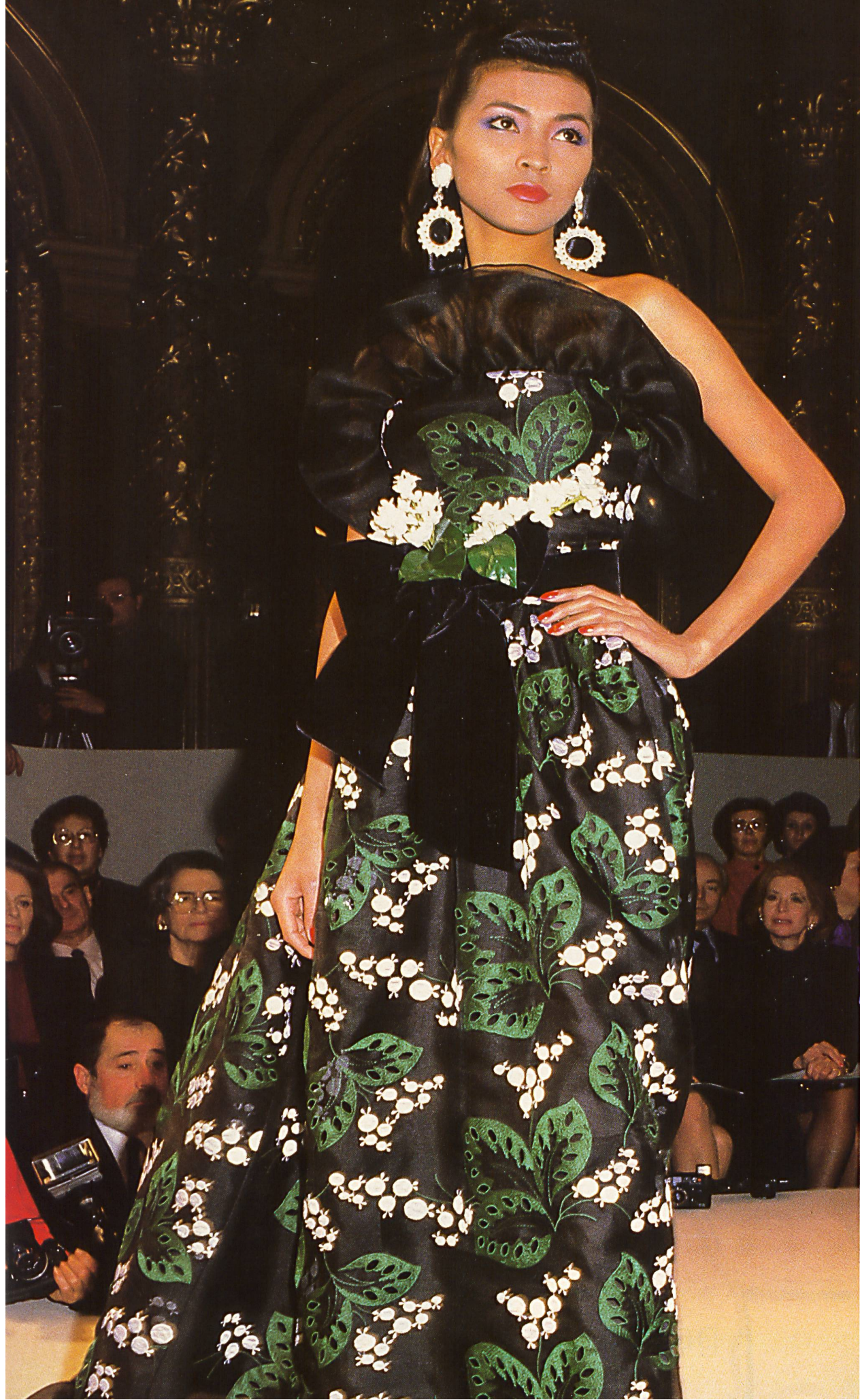
GIVENCHY Broderie anglaise bicolore. Two-tone broderie anglaise.